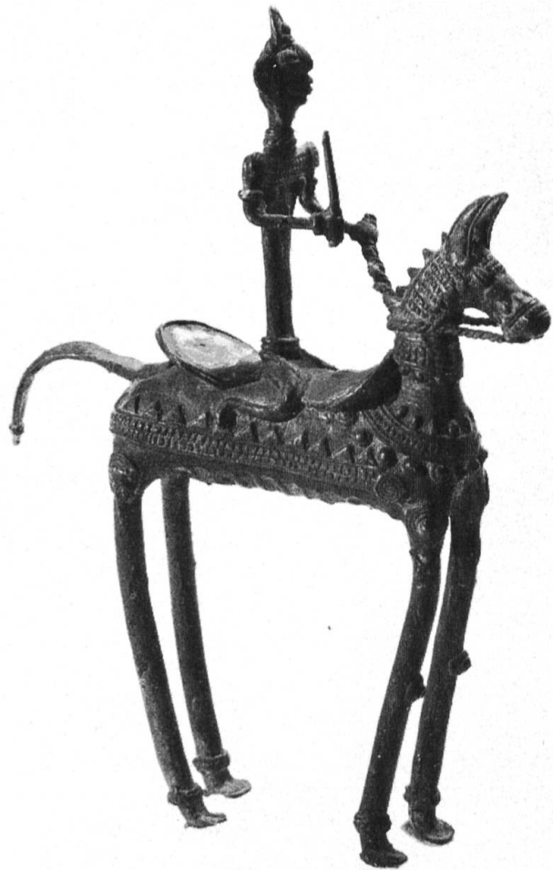
Ausstellung: Gelbgussarbeiten aus Bastar, Mittellindien. Ritualfigur aus einem Schrein.

Sie zeigt im Parterre den Schwerpunkt des Museums, Ozeanien , aus dem ja viele Basler Ethnologen wertvolle Sammlungen nachhause gebracht