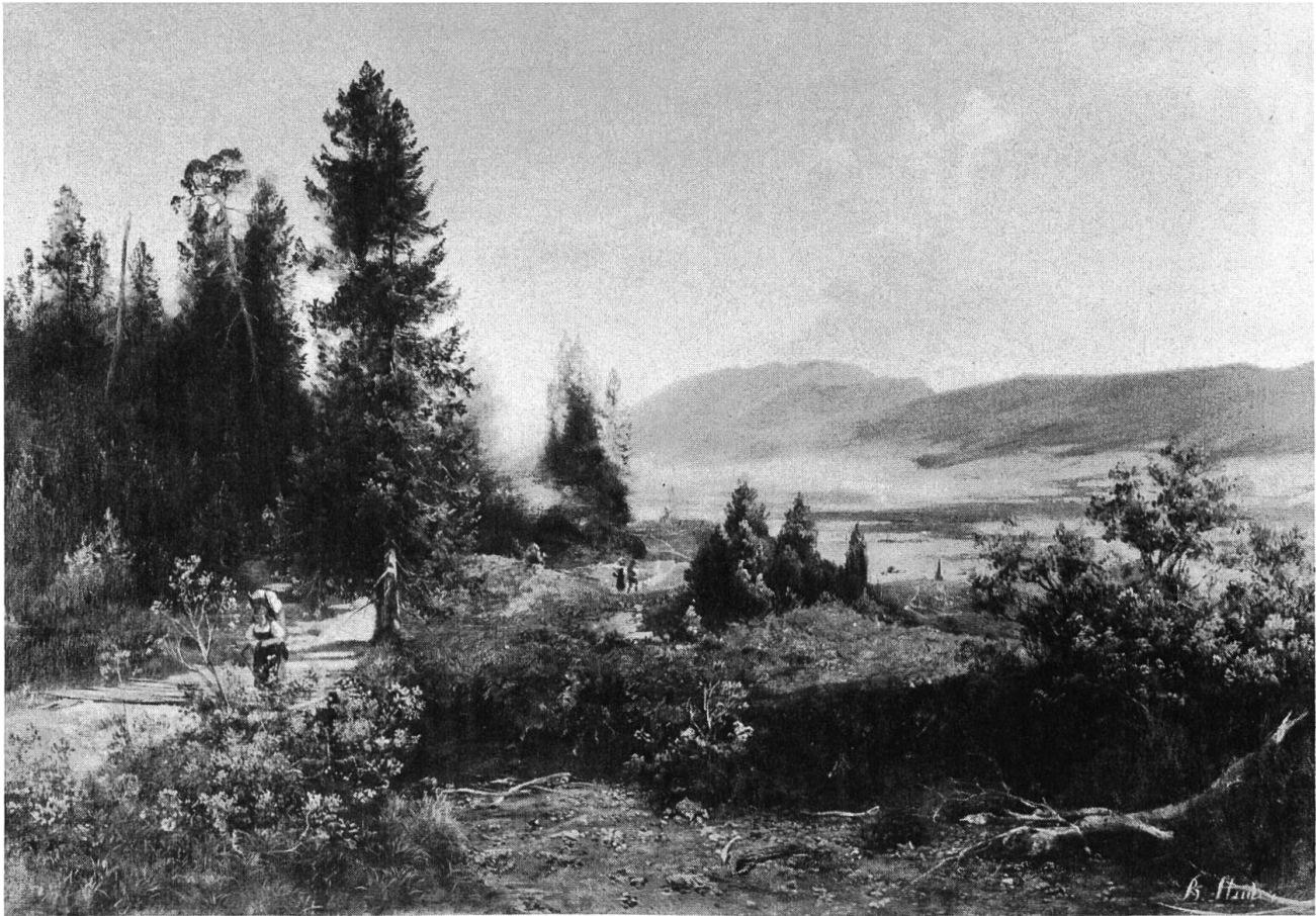
Das Gäu vom Kappeler Born gegen NW.

den Philistern» nicht beliebt gemacht. Der Aussage Brachts muss wohl eine gewisse Bedeutung zuerkannt werden, war er doch letztlich Professor und Senatsmitglied an der Akademie der bildenden Künste in Dresden.