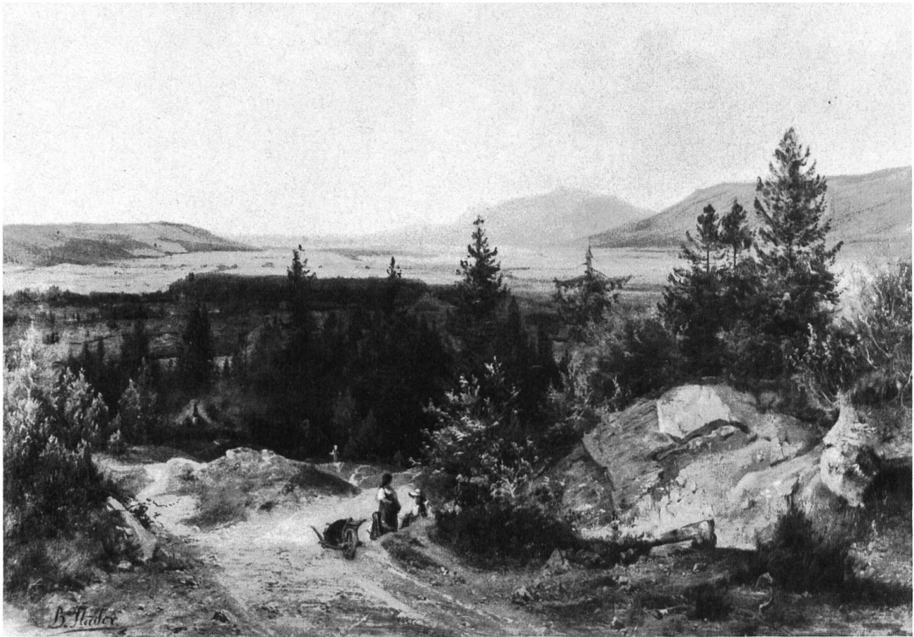
Das Mittelland vom Kappeler Born Richtung Solothurn.