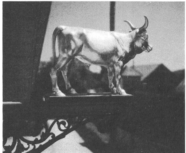
Vergoldete Plastik am «Ochsen» Neuendorf.

Wahrscheinlich mit der Einführung der Gewerbefreiheit von 1843 wurde in Niederbuchsiten ein Restaurant von Arx, heute «Linde» und in Neuendorf die «Hardeck» bewilligt. Um 1920 gingen die Tavernen- und Gasthofrechte an den Staat über und wurden in Wirtschaftspatente umgewandelt.