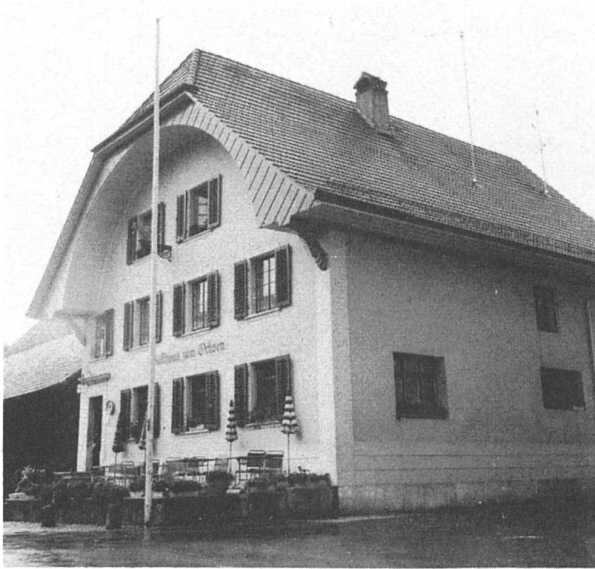
Gasthaus «Ochsen», Neuendorf.