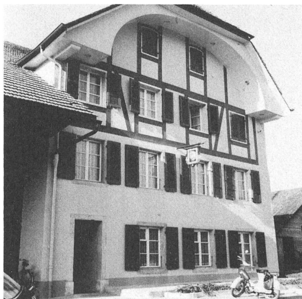
Gasthaus «Sonne», Niederbuchsiten, nach der Restaurierung.