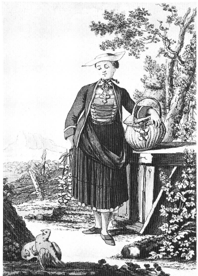
3 Bäuerliche Alltagstracht der Frauen im 18. Jahrhundert.

geliefert worden waren und für drei Schweine, die zum Verzehr ins Katharinenhaus gebracht wurden. Der Köchin im Thüringenhaus wurde täglich ein Mass, d. h. 1½ Liter Wein und wöchentlich 9 Brote verabreicht; die Köchin im Katharinenhaus durfte täglich einen Schoppen, d. h. etwa 3½ dl Wein und wöchentlich 3 Pfundbrote in Empfang nehmen. Fische und Schabziger wurden (mindestens 1761) durch eine «Gutschrift» in Geld ersetzt, offenbar infolge eines (vorübergehenden?) Mangels an solchen Viktualien. 7