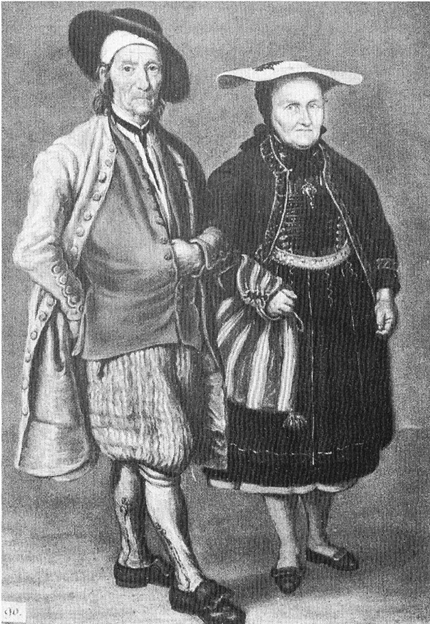
4 Trachten wohlhabender Bauern, 18. Jahrhundert.