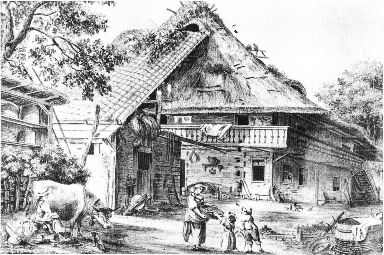
5 Solothurnisches Bauernhaus um 1790.

wegen Gottlosigkeit und Frömmigkeit, wegen Fastenspeisen und Lustigkeit, wegen Treuherzigkeit und Behaglichkeit. Essen tat man, was man hatte und je besser, desto lieber, trinken ebenso, und wenn man im Zweifel stand, ob man hinreichend habe für sich, begehrte man keinen fremden Gast; die Erfahrung hatte sie gelehrt, dass bloss Selbstessen fett mache. Man fastete dort nie länger, als man musste... Fasttage liebte man mehr als Arbeitstage und bei hinreichenden Schnecken zu dienlichem Sauerkraut, ellenlangen Forellen, tellergrossen Fröschen und Krebsen wie alte Katzen hätte man sich eine Verlängerung der Osterfasten gefallen lassen.» Und, vom Solothurner Nebel sprechend, meint Jeremias Gotthelf, wenn dieser an andern Orten einem Erbsenmus gleiche, «so ist er in Solothurn akkurat wie eine Schokoladecreme, Geruch und Geschmack ausgenommen». 11