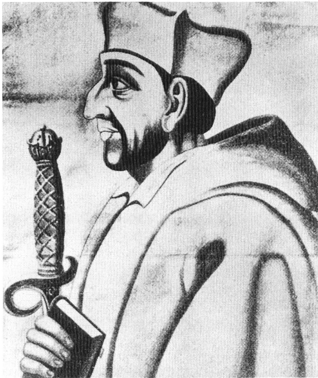
Kardinal Matthäus Schiner (Foto: Zentralbibliothek Solothurn).

nern. 7 Dass das Solothurner Kontingent, wie alle eidgenössischen Truppen in Italien, bei Julius II. in hohem Ansehen stand, kommt in einem Bericht der Solothurner Offiziere an die Regierung von Solothurn vom 28. Mai 1512, nach dem Einzug in Verona und vor dem berühmten Pavierzug, zum Ausdruck. 8 Sie melden darin, Schiner habe ihnen nach seinem Eintritt in Verona ein goldenes, gezieres Schwert und einen Fürstenhut als päpstliche Geschenke überreicht und ihnen überdies den päpstlichen Segen überbracht. Die im Dienste Julius II. kämpfenden Solothurner wurden vom Papst reichlich belohnt und geehrt. Wie alle eidgenössischen Stände erhielt auch Solothurn 1512 ein Juliusbanner mit dem schönen Eckquartier, das für Solothurn den Hl. Urs kniend vor Christus darstellt. 9 Das Juliusbanner für Solothurn ist im Alten Zeughaus zu sehen.