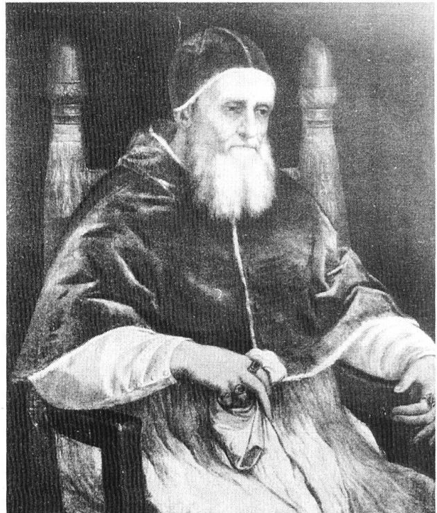
Papst Julius II., Gemälde von Raffael (Foto: Zentralbibliothek Solothurn).

Bereits 1509, am 14. Mai, liefen die ersten Verhandlungen zwischen Rom und der Eidgenossenschaft. 4 1510 kam das Soldbündnis mit Julius II. zustande. Es wurde von allen eidgenössischen Orten und den beiden Zugewandten St. Gallen und Appenzell