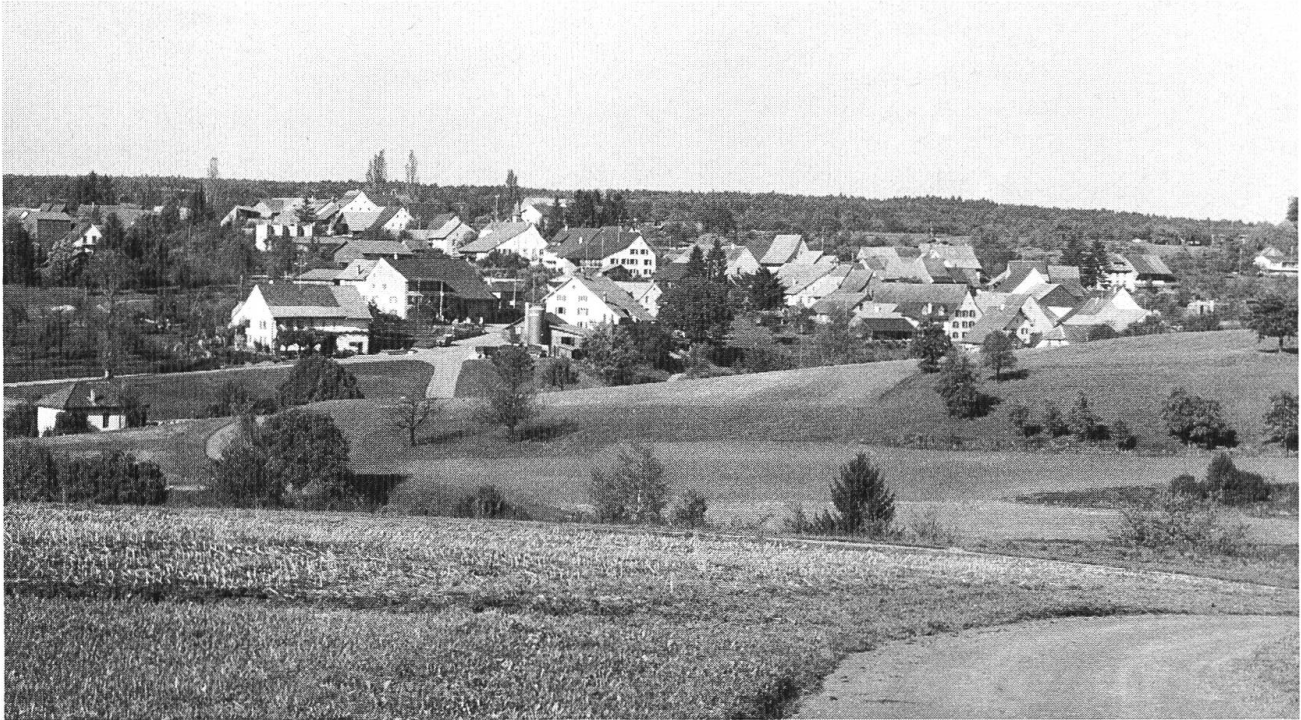
Anwil, ein schmuckes Bauerndorf im Tafeljura.