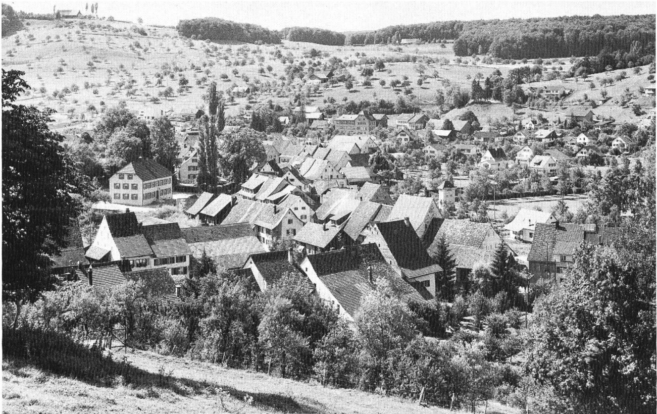
Ziefen, ein typisches Strassenzeilendorf in der Hugelzone.

Der Kanton Basel-Landschaft hat seine Landwirtschaft immer recht grosszugig gefordert und unterstutzt, durch direkte finanzielle Beitrage (Tierzucht, Subventionen) und durch institutionelle Hilfe. So wurde zur Unterstutzung der bauerlichen Gemusepflanzer, die seit dem Ruckgang der Heimposamenterei gefordert wurden, eine staatliche Gemusebaustelle geschaffen, welche bis zum heutigen Tag die Vertragsproduktion zwischen Landwirten und Grossverteilerorganisationen regelt und auch die Gemusevermittlung besorgt. Fur alle bedeutenden Betriebszweige unterhalt der Kanton Zentralstellen , die in der Regel durch die Fachlehrer der Landwirtschaftlichen Schule betreut werden. Wesentliche finanzielle Mittel setzt der Kanton ein zur Verbesserung der Produktionsgrundlagen in der Landwirtschaft. Im Zuge des Autobahnbaues wurden in den betroffenen Gemeinden Felderregulierungen durchgefuhrt. Hinzu kommen weitere Felderregulierungen auf Beschluss der Gemeinden und in zwei Gemeinden, wo keine Mehrheit zur