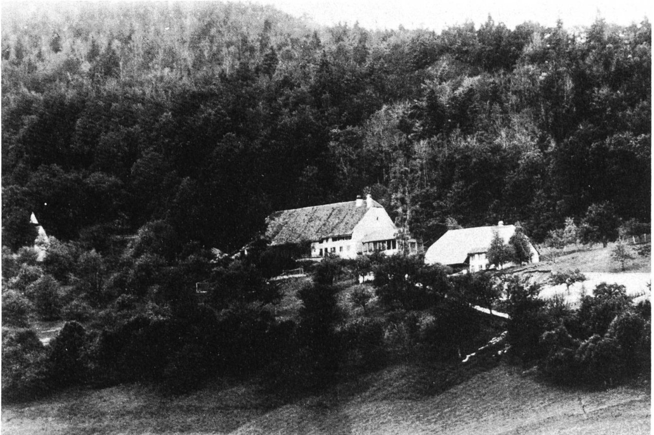
Die verschwundene Gebäudegruppe, wo heute die Heilstätte steht. Links die Kapelle, in der Mitte der Grimmsche Hof, rechts Bauernhaus der Familie Studer. Foto 1908.

meters Joh. Ludwig Erb, der 1759 den Grimmschen Berg und Hof ausmarchte und neu vermäss. 6 Der Löwenanteil mit gut 560 alten Jucharten entfiel auf den Hof Berkiswil mit Wiesen, Weiden und Wald. Dieses Gebiet lag zwischen Burgerraingrat sowie Eichhölzli im Süden und dem Drahtzieherkamm im Norden; im Osten grenzte es an Richenwil und entsprach damit dem Areal des heutigen Allerheiligenbergs. Dazu kam im Norden der Wuesthof und im Westen, an der Grenze zum baslerischen Bärenwil, der Hof Asp. Der alte Berkiswil-Hof aber, samt einigen nahe gelegenen Parzellen, verblieb im Besitz der bisherigen Eigentümer, der Bauernfamilie Studer. Als Pächter bewirtschafteten sie nun das Grimmsche Gut.