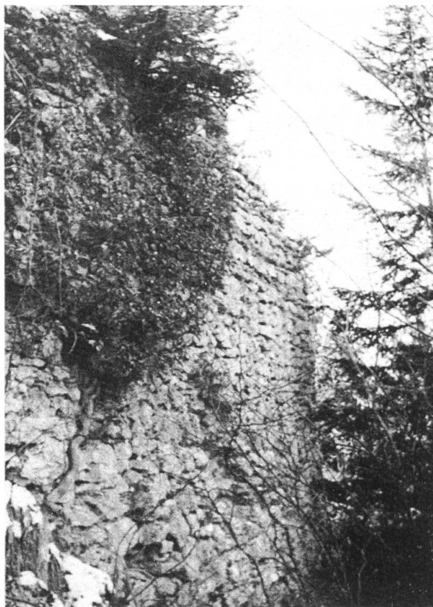
Ruinen der stolzen Burg Blochmont , Sitz der Blochmonter Linie der Eptinger. 1449 von den Baslern gebrochen, nicht mehr aufgebaut.

Neuwiller ist erstmals 1351 im Besitze der Eptinger; und zwar besaßen sie den vierten Teil des Dorfes, die übrigen drei Viertel hatten sie als Inhaber des Marschalkenamtes