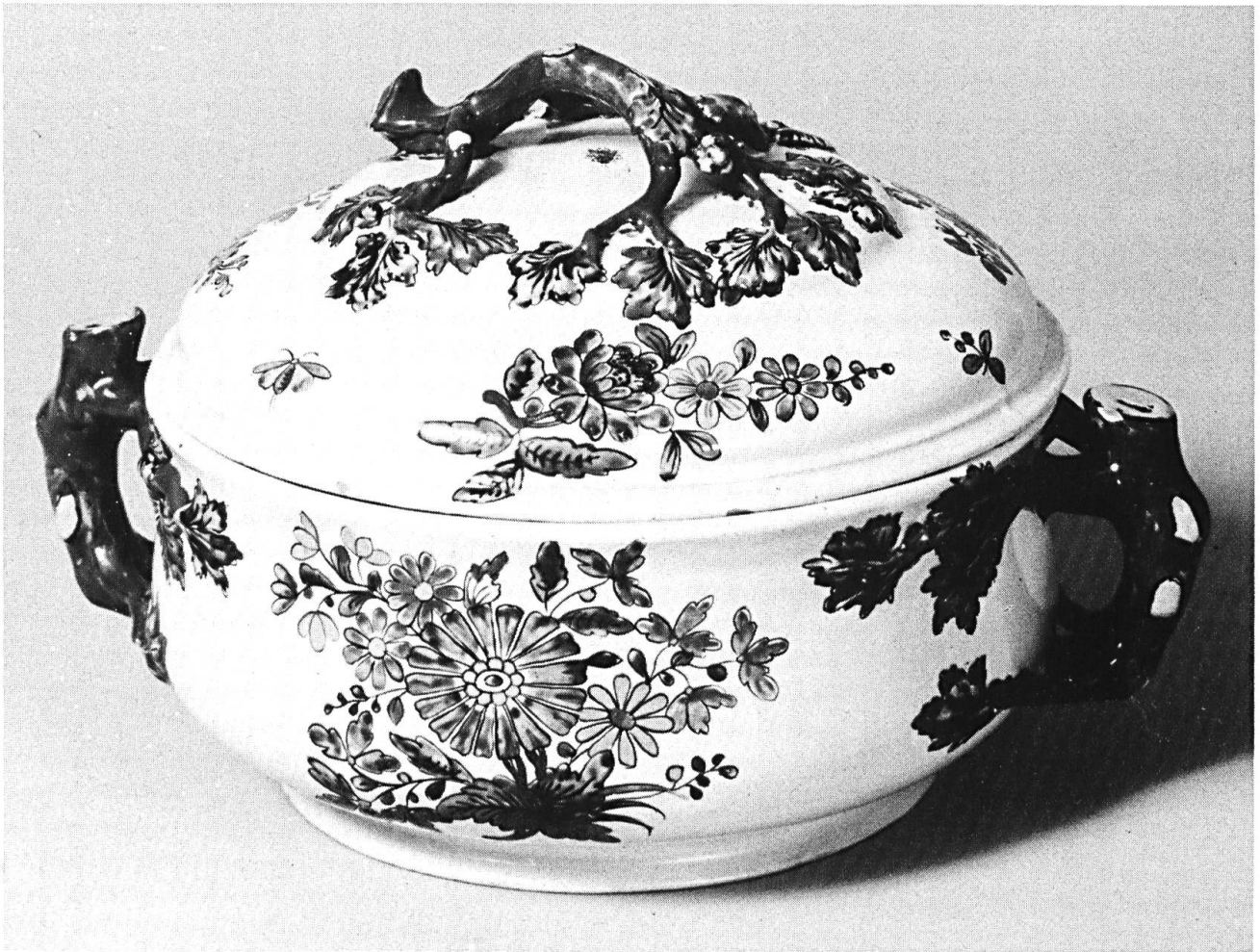
Deckelschüssel mit indianischem Blumendekor.