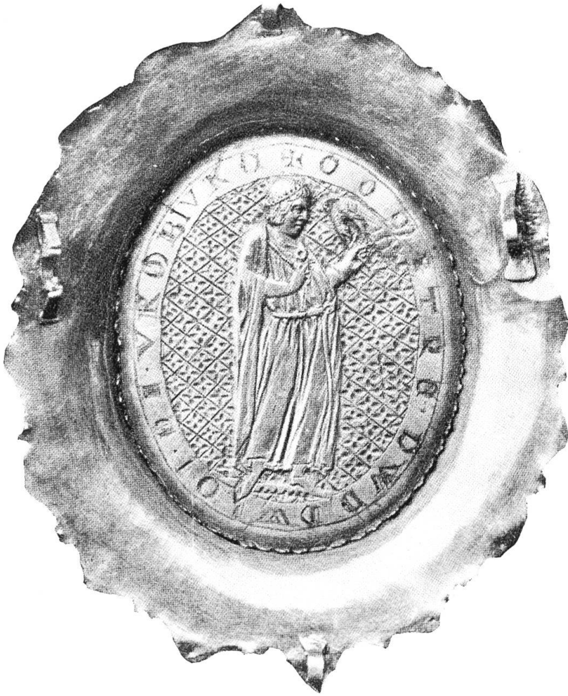
Rückseite des Onyx mit dem Falknermotiv und den Namenszügen des Grafen Ludwig von Froburg. Das «goldin Klainot» erscheint 1616 zum erstenmal im Vermögensverzeichnis der Stadt Schaffhausen. Seit dem Jahre 1928 ist es als «Onyx von Schaffhausen» im Allerheiligen-Museum ausgestellt.