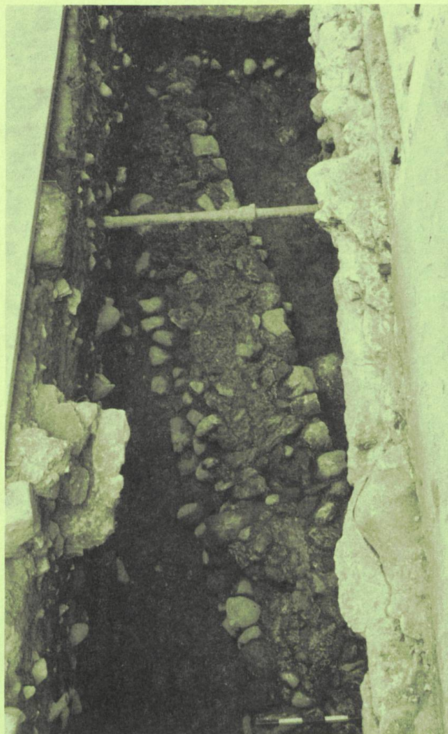
Die freigelegte römische Mauer hinter dem Restaurant «Adler».

Wie erwartet, wurden Siedlungsspuren des beidseitig der Aare bekannten römischen Vicus' aus dem 1. bis 3. Jh. n. Chr. angetroffen. In gut einem Meter Tiefe fand sich die Abbruchkrone einer mindestens fünf Meter langen Mauer, die in Richtung des Weinkellers der Bürgergemeinde weiterlief. Das Fundament war aus grossen Bollensteinen ohne Mörtel errichtet worden; die aufgehende Mauer, von der nur 1 bis 2 Steinlagen erhalten waren, bestand aus zugehauenen, mit Mörtel gefügten Bruchsteinen. Die römische Mauer hatte eine andere Orientierung als die heutige Parzellierung, die auf das Mittelalter zurückführt. Ihre Ausrichtung stimmt dagegen mit jenen römischen Resten von Holzbauten überein, welche vor einigen Jahren beim Umbau des heutigen Restaurant Panda zum Vorschein kamen. Wie die Keramikfunde aus den dazugehörigen Kulturschichten zeigen, stammen sämtliche Baureste aus dem 1. Jahrhundert n. Chr. Die Funktion dieser Bauten kennen wir nicht, dafür