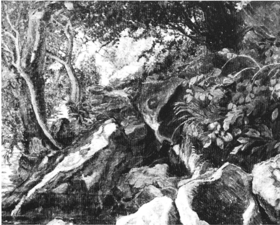
Kaltbrunnental, Ölbild 1915 (das im Artikel erwähnte, weiss übermalte «Schutzbild»).

Leinwand wäre wahrscheinlich zu teuer gewesen. Es zeigt eine Urlandschaft mit knorrigen, wildgewachsenen Laubbäumen in naturalistischer, altmeisterlicher Art gemalt. Das Laubwerk ist so dicht, dass nur ganz spärlich Licht auf den Boden fällt. Die Kalksteine, die dem Wasser seine Richtung geben, und die andererseits vom Wasser in Tausenden von Jahren geformt wurden, hat der junge Künstler im expressionistischen Stil auf das Sackgewebe gepinselt. Das Zentrum des grossformatigen Bildes ist ein heller Durchblick auf die vom Sonnenlicht förmlich überflutete Sommer-Blumenwiese, in einer Ausdrucksweise, wie wir sie bei Pissaro finden oder eher noch im Pointillismus-Stil. Man spürt förmlich, wie er am Suchen seines eigenen Malstils war. Dieses Bild hat bis zu seiner Entdeckung kein Mensch gesehen – so wollte es der Künstler.