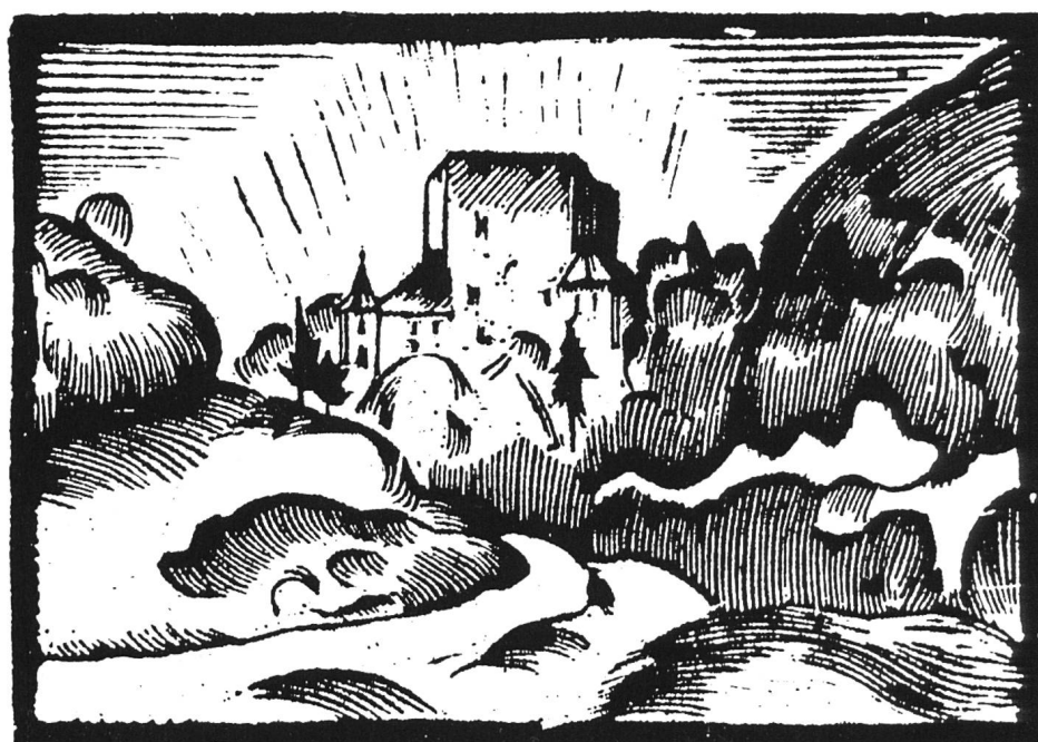
Schloss Angenstein, Holzschnitt von 1922.

persönlichen Erlebens, waren wichtig. Im Vordergrund standen bei ihm die verschiedenen Jahreszeit-Stimmungen und die entsprechenden Farbtonalitäten im Wandel der Tageszeit und der Spiegelungen auf dem Wasser. Das ihn faszinierende gedämpfte Licht bei bewölktem Himmel fand er nicht nur in seinem geliebten Jura, sondern auch im Lötschental mit dem majestätischen Bietschhorn und der paradiesischen Blu-