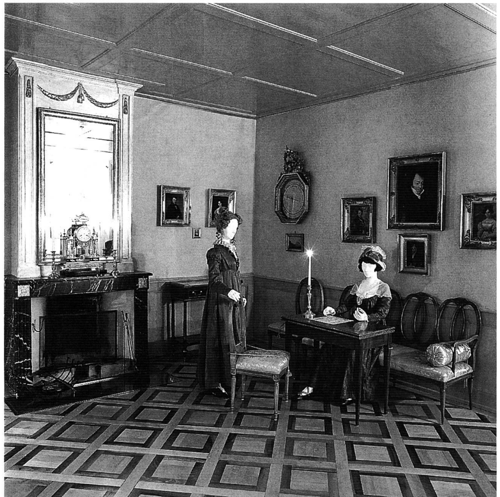
Wohnen und Haushalten: Der Salon der bürgerlichen Wohnung.