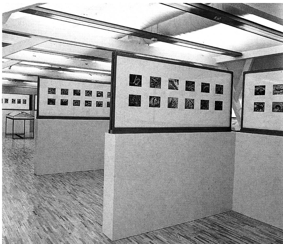
Stiftung Sammlung Robert: Pflanzen- und Tieraquarelle.