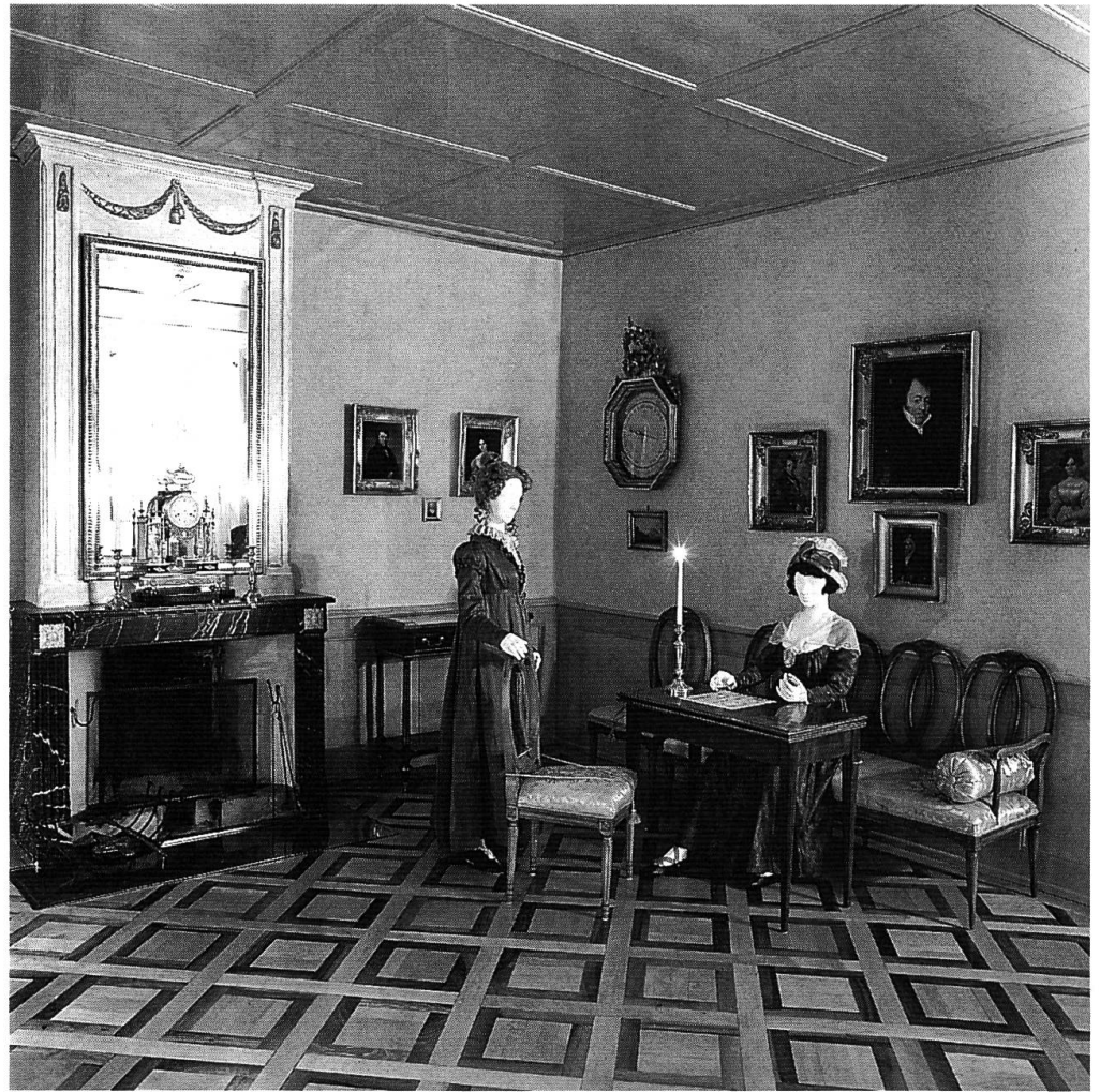
Wohnen und Haushalten: Der Salon der bürgerlichen Wohnung.