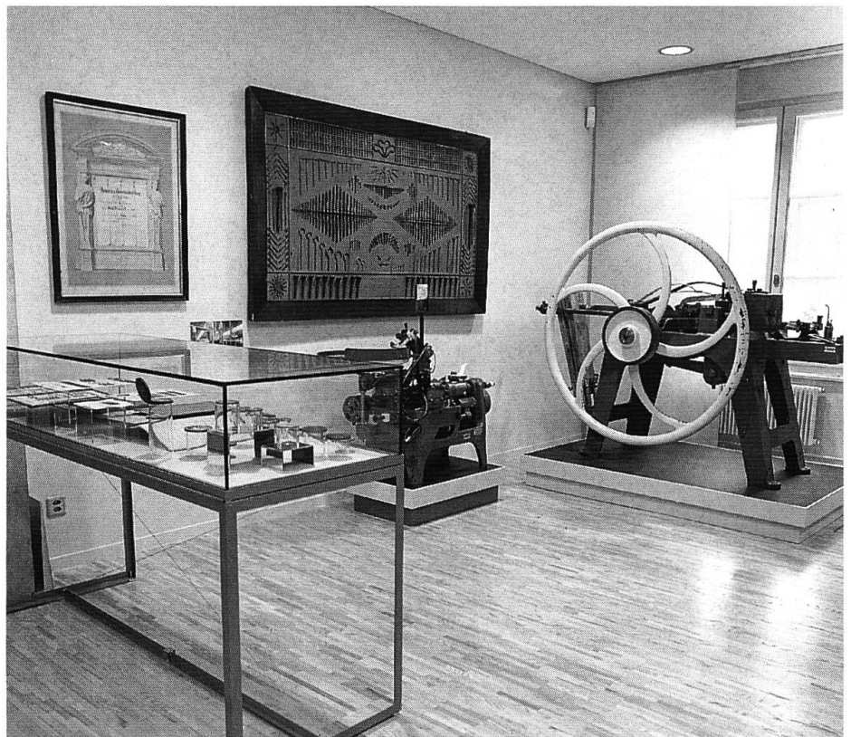
Zur Industriegeschichte Biels: Nagelpresse und Schrauben- fräsmaschine zur weiteren Verarbeitung des in Biel gezogenen Drahtes.

d'Horlogerie La Chaux-de-Fonds, Omega Museum Biel, Firmenmuseum Longines St-Imier usw.) sinnvoll zu ergänzen. Natürlich finden sich zahlreiche Beispiele von Uhren aus Bieler Produktion. Es werden aber nicht einfach nur Uhren ausgestellt, sondern es werden vor allem unterschiedliche Aspekte der Uhrmacherei beleuchtet. Die Entwicklung der Uhrentechnik, die Dekoration von Uhren, die Abhängigkeit vom Weltmarkt und die damit verbundenen Krisen usw. Insbesondere wird die Entwicklung der Uhrenproduktion von der Heimarbeit und den kleinen Ateliers bis zur modernen Uhrenfabrik thematisiert. Als Folge der zunehmenden Mechanisierung der Uhrmacherei im ausgehenden 19. Jahrhundert wuchs die Nachfrage nach Präzisionsmaschinen. Hier liegen die Wurzeln der Maschinenindustrie, dem heute grössten Bieler Industriezweig.