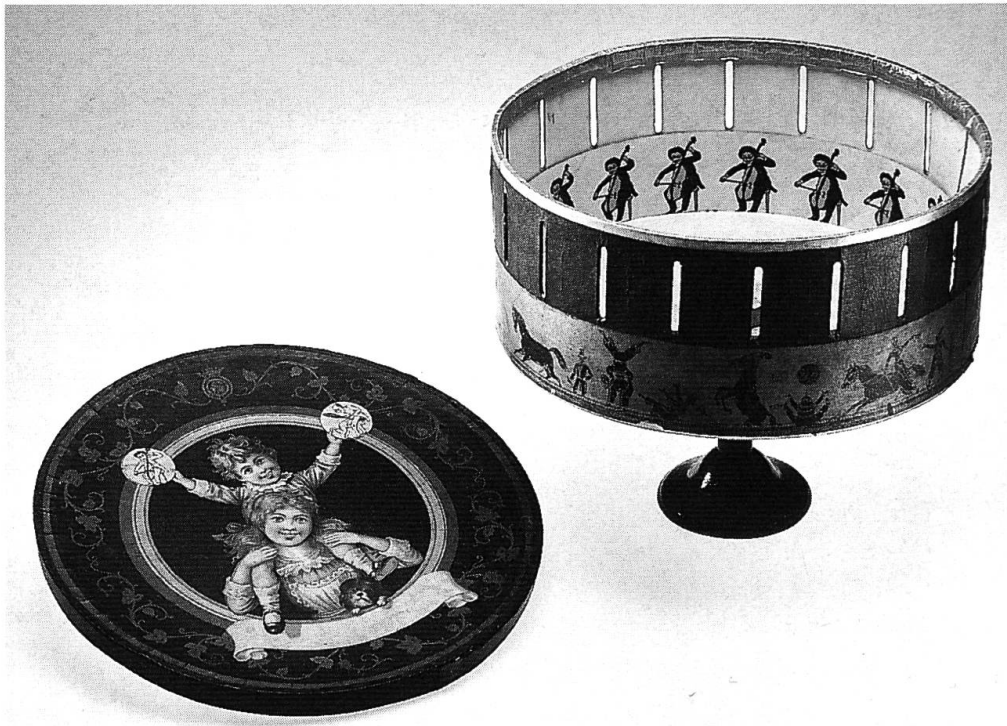
Aus der Cinécollection William Piasio: Optisches Spielzeug oder die Anfänge des bewegten Bildes: Zootrop. Deutschland, um 1890.