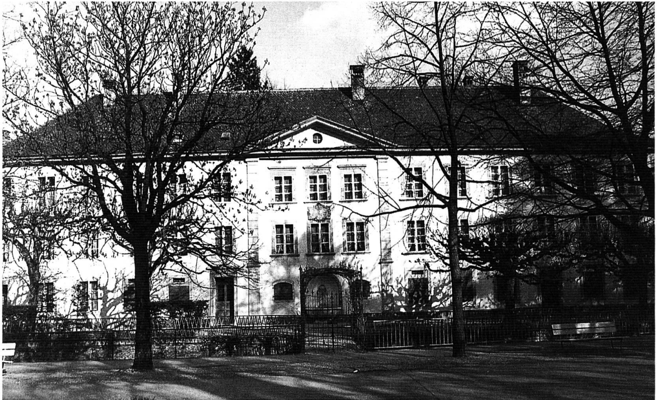
Museum Neuhaus Biel: Westteil des Museumsgebäudes.