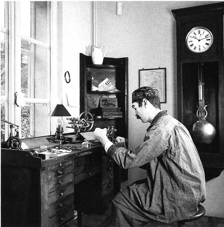
Zur Industriegeschichte Biels: Uhrenarbeiter am Etabli.