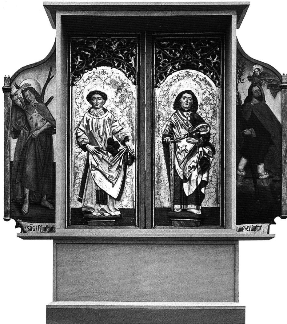
Churer Altar: Ansicht des rekonstruierten Schreingehäuses von der Rückseite. Das Fehlen der Rückwand ermöglicht den Blick auf die Schnitzreliefs der Heiligen Stephanus (l.) und Matthäus (r.). Die Malereien auf den seitlichen Standflügeln zeigen die Heiligen Sebastian (l.) und Christophorus (r.).

tars, der Schrein mit den geschnitzten Holzfiguren, fehlte schon 1877, als das Altarfragment von einem Basler Kunsthändler angekauft wurde. Dieser seinerseits hatte die Tafeln in Chur erstanden, weshalb das Werk als «Churer Altar» bezeichnet wird.