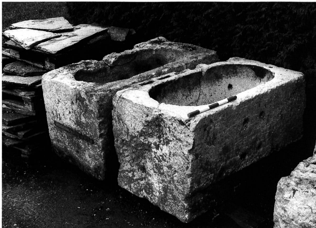
Abb. 1 Kalksteinwannen aus dem ehemaligen Bad Quellenthal.

Das Bad stand während seines ganzen Bestehens in einer engen Beziehung zur Papiermühle und zur Familie Ziegler aus Solothurn, die damals das ganze Gelände zwischen den beiden Armen der Oesch besass. Die Papierfabrik wurde um 1788 an der Stelle einer Hammerschmiede eingerichtet, 1798 gelangte sie an die Ziegler 9 und blieb fast 100 Jahre in ihrem Besitz. Nach dem Katasterplan und Grundbuch von 1817/18 beziehungsweise 1824 zu schliessen 10 , existierte schon zu dieser Zeit ein kleines Badhaus am westlichen Oeschbach. Dieses gehörte zusammen mit Papiermühle, Wohnhaus und anderen Nebengebäuden (Leimküche, Glättihaus) zur Hofstatt der Familie Ziegler. Das Bad als öffentliche Anstalt lässt sich erst ab 1831 belegen, als das Recht, eine Kaltwasser-Badeanstalt (das Quellenbad) neben der Papiermühle einzurichten, an Josef Ziegler-Barthlimé