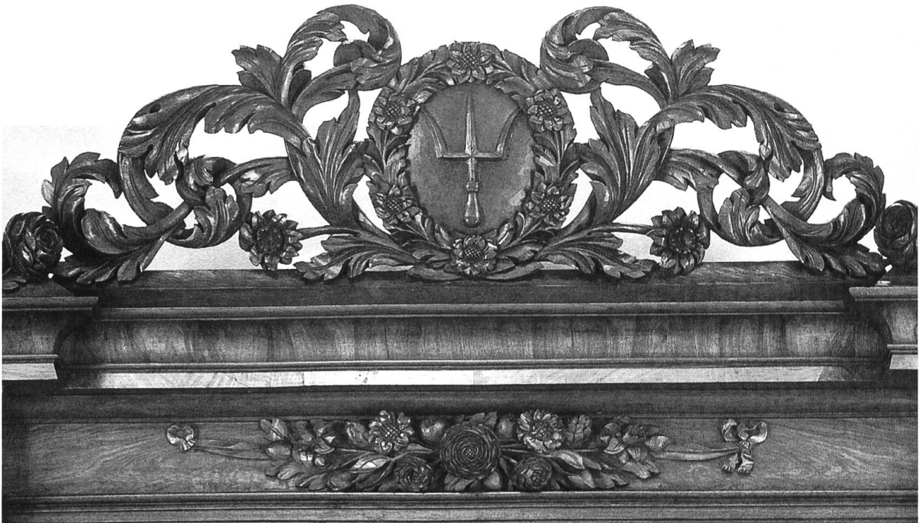
© Detail vom Buffet der Gartnernzunft mit dem geschnitzten Zunftwappen.

lich herausgefunden, dass im Jahre 1840 (also nur wenige Jahre nach der Versteigerung des Basler Münsterschatzes), das Buffet der Safranzunft in den Basler Kunsthandel verkauft wurde und darauf in Berliner Museumsbesitz gelangte. 3