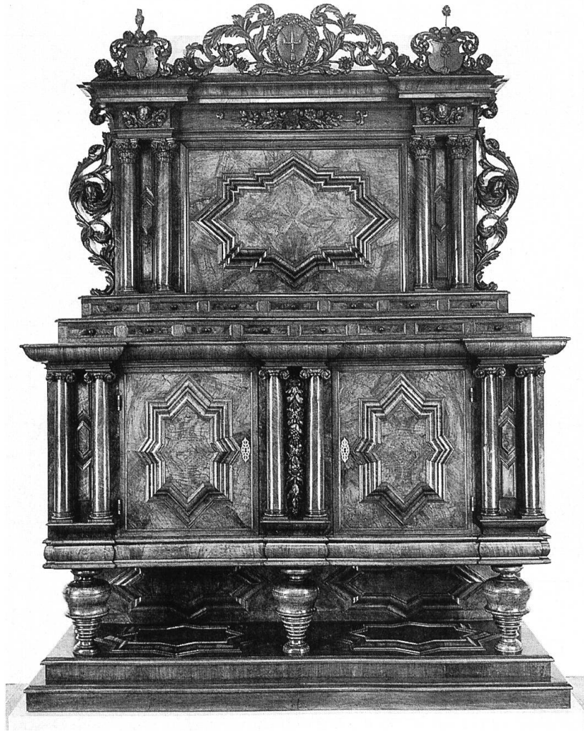
④ Buffet der Gartnergazunft, von Matthias Müller. 1710. Nussbaumholz. (Historisches Museum Basel, Inv. Nr. 1901.54. Depositum E. E. Zunft zu Gartnern).

Bis ins frühe 18. Jahrhundert, als das Basler Buffet allmählich aus der Mode kam, blieb sein Grundaufbau gleich. Doch der Barockstil ermöglichte zahlreiche Spielarten von unverwechselbaren, charaktervollen Möbeln.