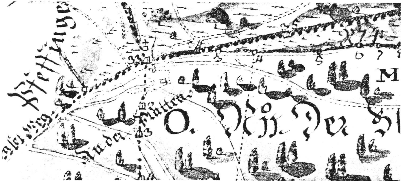
Ausschnitt aus dem «Brunnerschen»-Plan, gut sichtbar das Gebäude am Plattenpass.

Auch am Weg liegender Schutt wird dazu verwendet. Unmittelbar auf der Passhöhe, etwa 10 Meter nördlich des Grenzsteines, stiess man auf Reste eines Gebäudes mit verputzten Mauern und mit Backsteinboden.»