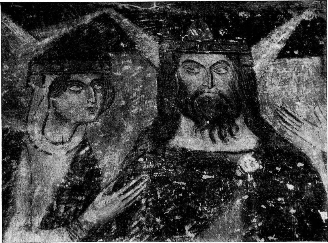
Münster, Klosterkirche. Ausschnitt aus dem Wandgemälde mit der Darstellung des Gastmahls Herodes. Um 1280. Nach einer photographischen Aufnahme von H. Boissonnas. Zum Vergleich mit der Konturzeichnung der Abbildung links aus der Zeit um 1900.

Der wissenschaftliche Vortrag. Auch die frühe Morgenstunde am Sonntag konnte die wissensdurstigen Mitglieder nicht davon abhalten, zahlreich zum Vortrag von Alb. Knoepfli , dem Verfasser des ersten Bandes thurgauischer Kunstdenkmäler, zu erscheinen. Da er als Bearbeiter dieses Gebietes nicht nur einen einzelnen Bezirk erforscht, sondern den Kanton als Ganzes betrachtet, konnte er in seinen sprachlich wohlformulierten Ausführungen einen interessanten Überblick über Eigenart der thurgauischen Kunstentwicklung geben. Er zeigte, wie an Stelle der im Mittelalter vorwiegend über Konstanz geleiteten Impulse einer dominierenden Bodenseekunst seit der Renaissance Einflüsse aus den verschiedensten Richtungen traten, wobei neben Süddeutschland hauptsächlich Vorarlberg bestimmend wurde. Das wohlüberlegt ausgelesene Bildmaterial in Form von ausgezeichneten Diapositiven offenbarte dem Zuhörer, was der Kanton noch an herrlichen Kunstschöpfungen für die Leser der Kunstdenkmälerbände zu versprechen vermag. Wir denken dabei zum Beispiel an die überragende Bedeutung der frühgotischen Plastik aus dem Kreis von St. Katharinenthal. Der Referent konnte am Schluß reichen Beifall entgegennehmen. Die kunsthistorischen Vorträge entsprechen, wie der diesjährige wiederum bestätigt hat, einem allgemeinen Bedürfnis und gehören somit zur guten Tradition der Jahresversammlungen.