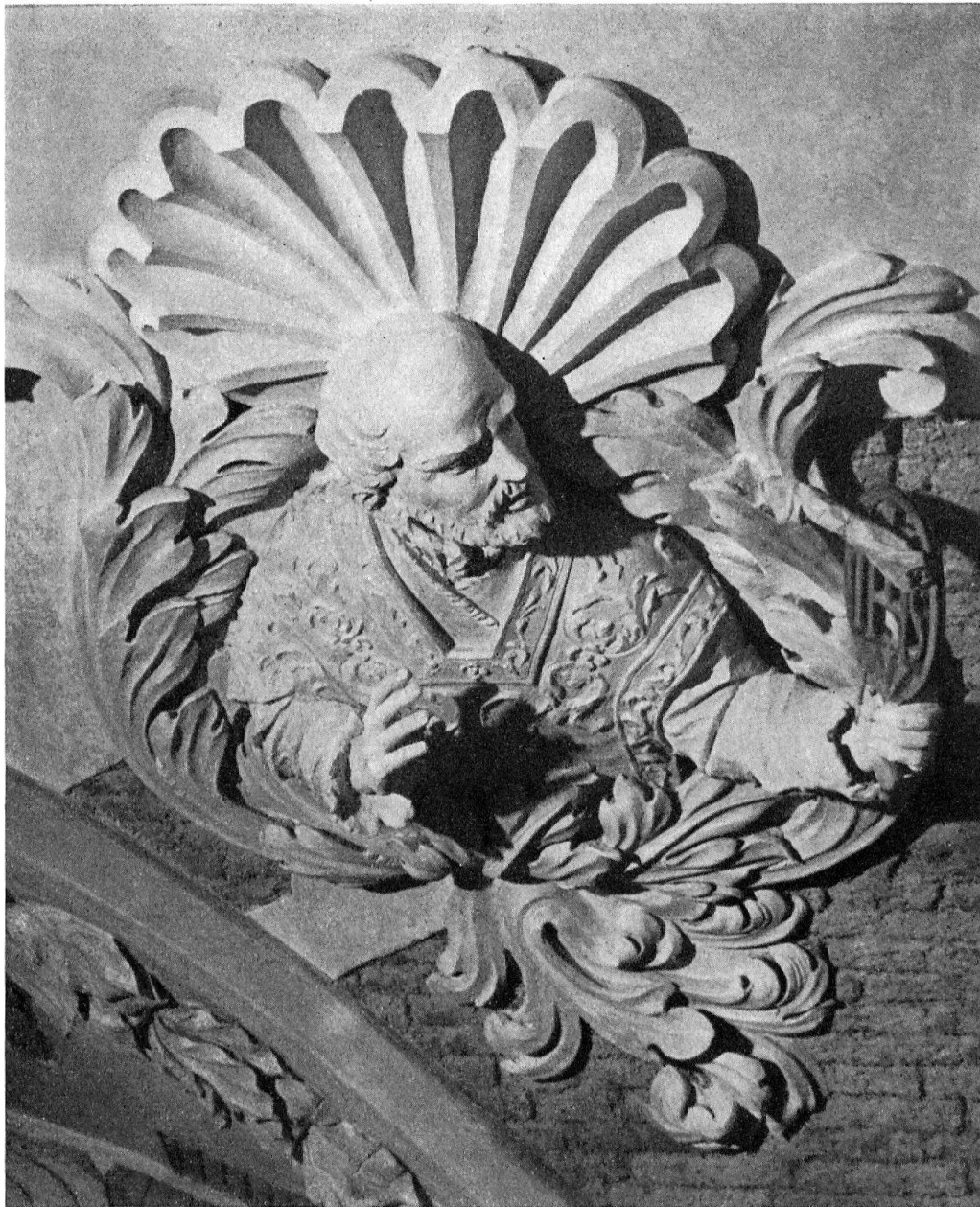
Solothurn, Jesuitenkirche. Stuckdetail der Decke, hl. Ignatius.