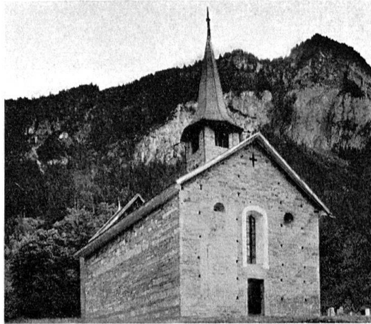
Zillis. Ansicht der Kirche St.Martin von Norden

Im Jahre 1953 wurden die Beiträge an die Restaurationsarbeiten am Siechenhaus in Burgdorf (Saldo Fr. 235), am «Unterhof» in Dießenhofen (Saldo Fr. 250) und an die Prozessionsfahne in der Pfarrkirche Lostallo (Saldo Fr. 500) vollständig ausgezahlt; über die Arbeiten selber wurde im Mitteilungsblatt 1953 S. 12 berichtet.