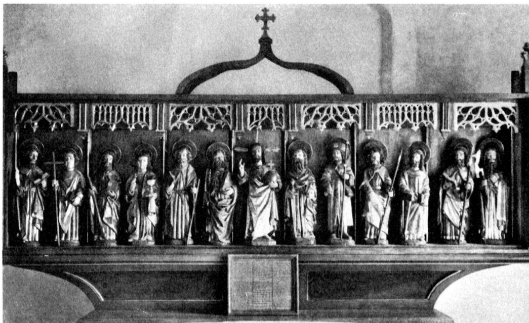
Franex, chapelle, le Christ et les apôtres