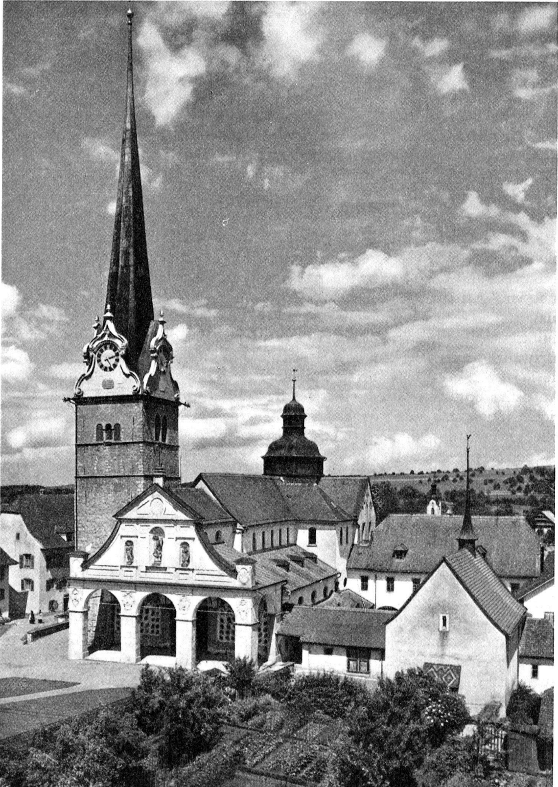
Beromünster. Ansicht der Stiftskirche von Süden