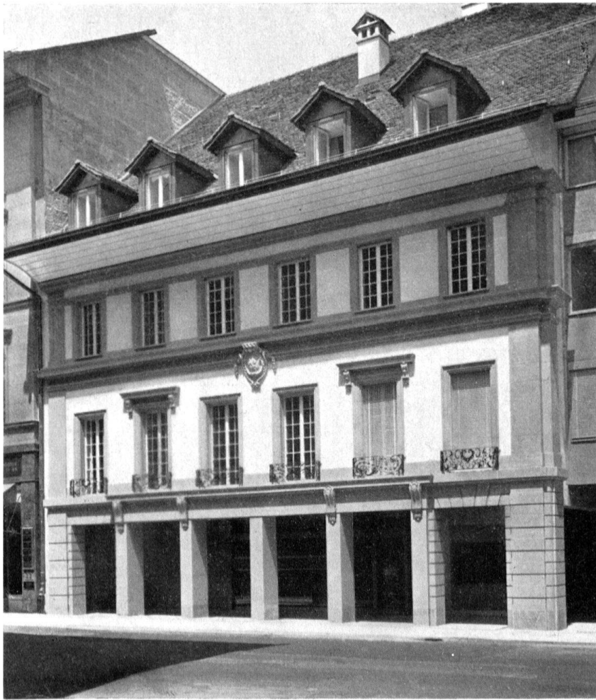
Gleiche Ansicht nach Abschluß des Gesamtumbaus durch die Architekten H. und G. Reinhard, Juni 1958

wieder eingeführt; die Fensterläden, ebenso «heimelige» als provinzielle Zutat des kompositionell völlig unempfindlichen 19. Jhs., wichen Lamellenstoren; Mai 1958 war die Umgestaltung abgeschlossen (Abb. oben). Heute stammen nur noch die guten schmiedeeisernen Fenstergeländer am Hauptgeschoß aus dem 18. Jahrhundert.