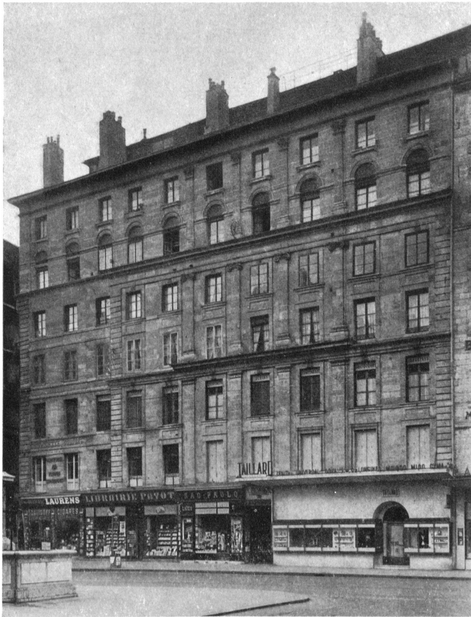
Ancienne maison Bonnet à Genève, façade principale

du XIV e siècle, qui débarquait ici marchandise et victuailles. La maison qui fermait la place du côté lac a été abattue au siècle dernier. Mais du côté opposé s'élève une façade qui est certainement l'une des plus hautes de l'architecture française du XVII e siècle. La tradition de cité réformée, poussant en hauteur ses maisons, à l'étroit dans les remparts, est interprétée ici dans un goût de grandeur digne du siècle de Louis XIV, bien que la façade ne se développe que sur 10 travées, au lieu des 13 prévues (d'où l'aspect asymétrique). Les trois travées centrales sont ordonnées par des pilastres à trois ordres superposés (dorique, ionique, corinthien), chaque ordre embrassant deux étages. Les en-