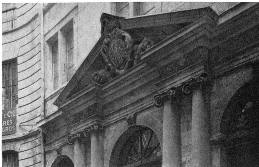
Ancienne maison Bonnet à Genève. Détail du portail dans la cour