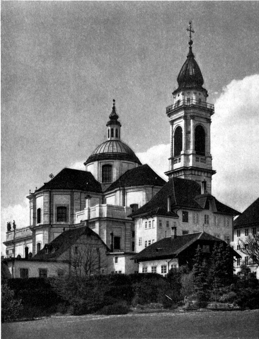
St. Ursen in Solothurn

Herausgegeben von der Gesellschaft für Schweizerische Kunstgeschichte