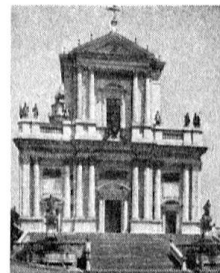
St. Ursen Solothurn