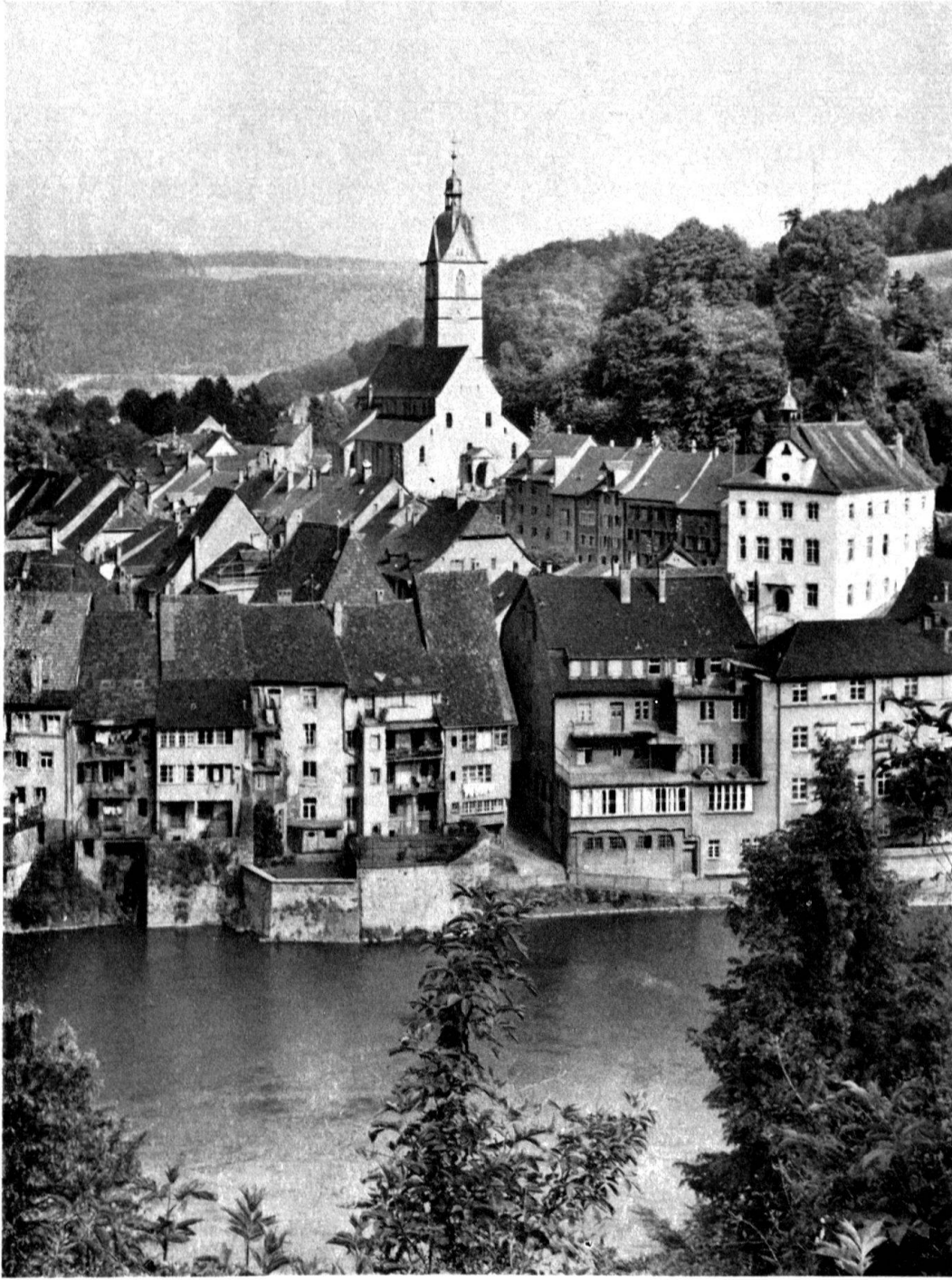
Laufenburg. Ansicht von Nordwesten