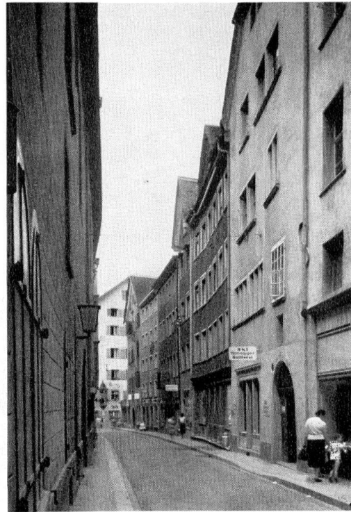
Reichsgasse, mit den behäbigen Bauten

fabrizierten Elemente erheischen große Fensteröffnungen, und das kostspielige Dach wird durch eine Betonplatte ersetzt. Wie aber sollen breite Kuben, ausgehöhlte Erdgeschosse, die flachen Dächer und die offenen Fassadenwände, die breiten Straßen und die Reklamanlagen noch maßstäblich zu den alten Häusern passen? Das sind Gegensätze, die unüberbrückbar sind.