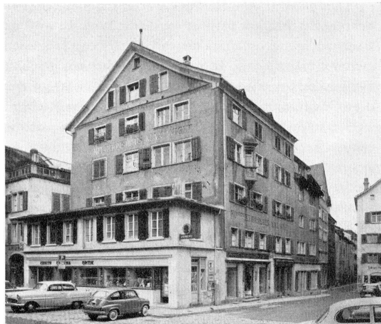
Martinsplatz. Ein wichtiger Kopfbau zwischen zwei Gassen am mittelalterlichen Platzgefüge: Neubau und Altbestand

waren die Häuser im Erdgeschoß viel geschlossener. Wir kennen noch Beispiele aus der Kirchgasse und aus der Rabengasse. Uns ist aber eine Stadt mit Schaufenstern überliefert worden. Wir können nicht zurück, so wenig wie wir den St. Luzienturm von 1937 abgerissen, die Zwiebelhaube des Domes von 1828/29 entfernt und den St. Martinsturm (1917) in seinen spätgotischen Zustand zurückversetzt haben. Es ist ein echtes Bejahen des Churer Stadtbilds, wenn die Läden als ein wichtiger Bestandteil anerkannt werden.