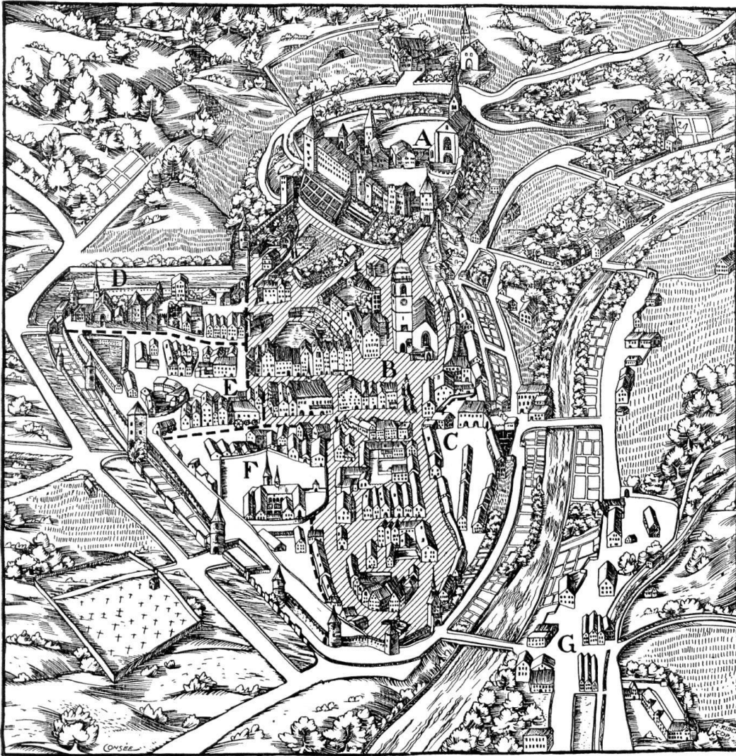
Chur. Planprospekt um 1640. Nach einem Ölgemälde aus dem Schloß Knillenberg. Umzeichnung M. Risch

zum besten bestellt ist. Wie oft in vielen der Häuser elende Wohnverhältnisse anzutreffen sind, ist langsam bekannt geworden. Es fehlt an den hygienischen Einrichtungen, es fehlt zum Teil auch an den Menschen, die nicht immer mit Alt-Chur verbunden sind. Aber auch das äußere Gesicht ist arg entstellt. Der eintönig schmutzig-graue Besenwurf überzieht manches Haus. Die Gestaltung der Schaufenster verdirbt gar viel. Manches Haus ist abgebrochen und durch ein schlechtes ersetzt worden; dies gilt für das zu unrecht verurteilte 19. Jh., dies gilt für uns selbst. Zu diesen inneren Schädlingen sozialer und ästhetischer Herkunft gesellt sich ein anderes: der moderne Mensch.