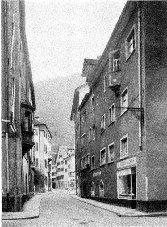
Planera, gotische Häuser und das Regierungsgebäude, eine der schönsten Veduten