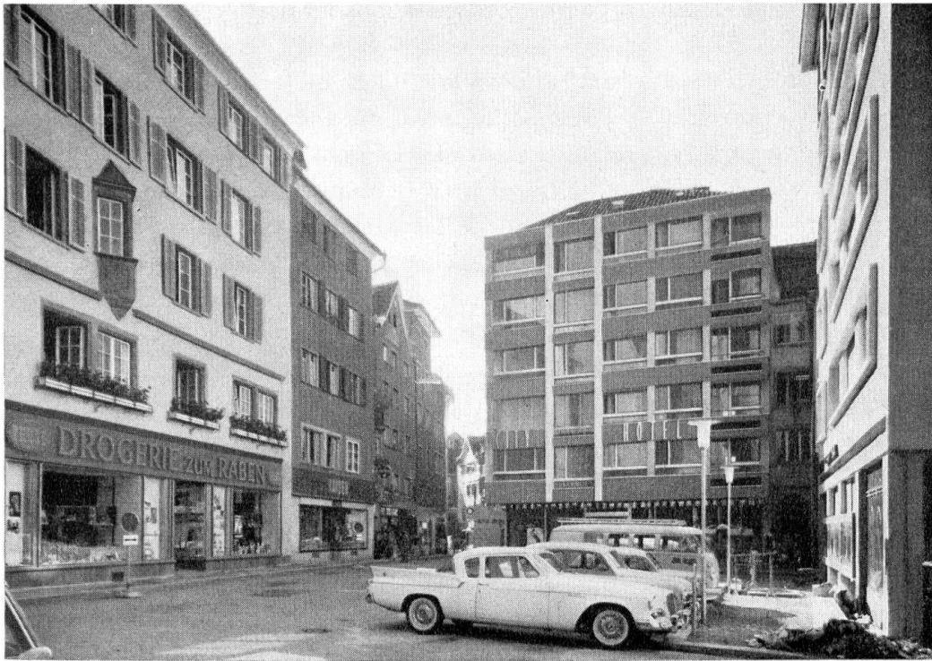
Martinsplatz, das Cityhotel

sein – jeder spürt, daß er sich in der Altstadt befindet, sobald er deren Grenzen überschreitet. Soll das Gefüge nicht verschwimmen und die Ausdehnung nicht reduziert werden, so muß dem Stadtrand unsere erste Aufmerksamkeit gelten. Eine hervorragende Grenze bildet die Grabenbebauung, die uns das 19. und das beginnende 20. Jh. hinterlassen hat. Eine Freifläche besteht bei der Planaterra und an der Plessurseite sind die Gebäude auf der Stadtmauer und die Herrenhäuser zu erhalten. Exponiert ist der innere Stadtrand am Graben und die Poststraße. Zur guten Geschäftslage kommt hier der teilweise schlechte Bestand, der nicht viel Altes enthält. Und dennoch kann hier eine Neuüberbauung nur mit aller Vorsicht zustande kommen, ja an der Poststraße ist darauf, wo immer möglich, zu verzichten. Die Bauvolumen dürfen nicht vergrößert werden. Es sind Bemühungen im Gange, welche hier eine neue Stadtmauer mit hohen Häusern erstreben und Akzente setzen wollen; damit aber wird der alte Städtemaßstab vom Rande her gebrochen und das Neuquartier in das ehemalige Gefüge gezogen. Es wird dieses Problem schwer zu lösen sein – man bedenke aber: der Altstadtrand bestimmt ganz wesentlich das Gesicht der Altstadt.