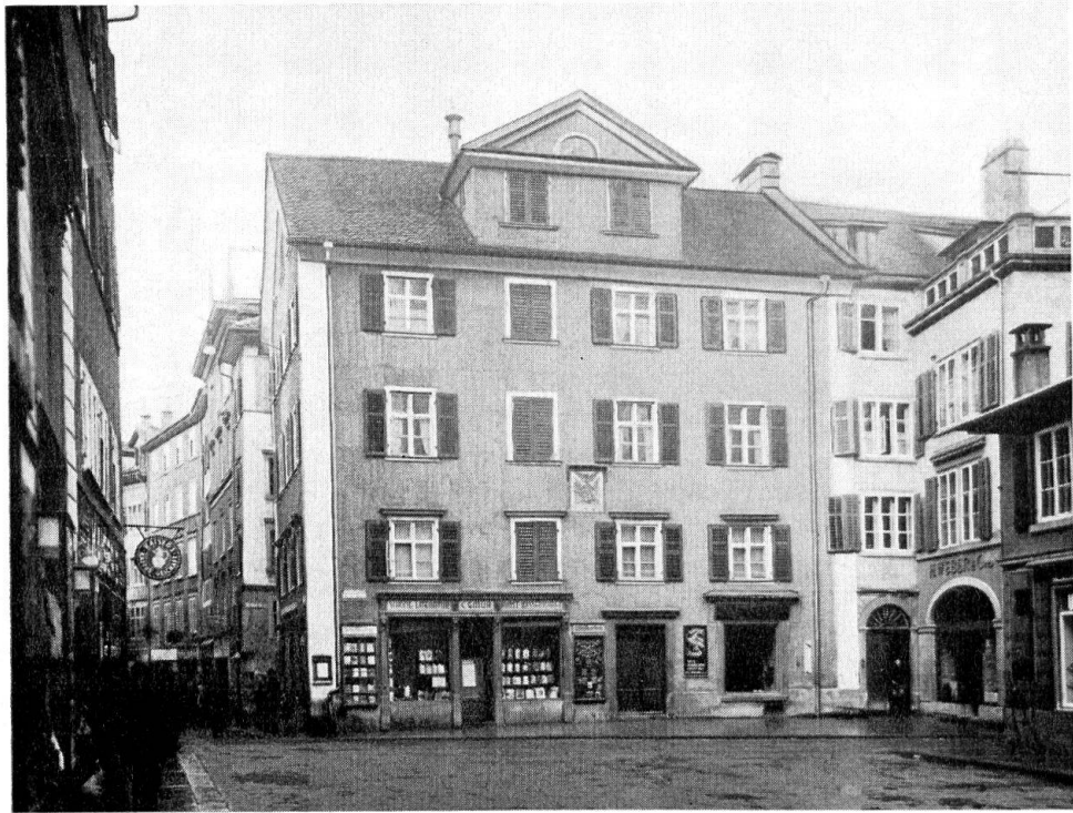
Martinsplatz. Der bescheidene, aber gute Vorgänger des Cityhotels

schwierigere bauliche Aufgabe, als das Einfügen eines neuen Hauses in eine alte Umgebung. Und die Konsequenzen? Wenn wir einzelne Häuser auswechseln, so wird eine Altstadt aus lauter neuen Häusern entstehen, in denen die kostbaren Bauten als Denkmäler isoliert dastehen. Was aber soll uns eine Altstadt aus Häusern, die an nicht mehr Vorhandenes angepaßt sind? Und noch etwas drängt uns zur Erhaltung: Deutschland und Frankreich haben ganze Städte verloren. Viele sind in alter Form neu erstanden. Mögen wir uns dazu stellen wie wir wollen, an Originalen ist nichts mehr da. Und dennoch ist dieser Vorgang ein Zeugnis dafür, welche Gewalt das hergebrachte Altstadtbild in uns ausübt. Wenn wir aber unsere Altstadt erneuern, indem wir die Häuser auswechseln, dann geschieht uns langsam und unbemerkt das, was das Ausland auf einen Schlag erleben mußte; wir verlieren die originale Altstadt. Es würde uns ein Substrat bleiben, eine Kopie, wie sie viele als Erinnerung an Vergangenes erdulden müssen.