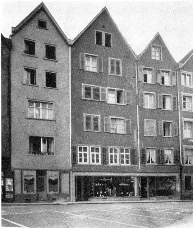
Obere Gasse, mit den schmalen Häusern