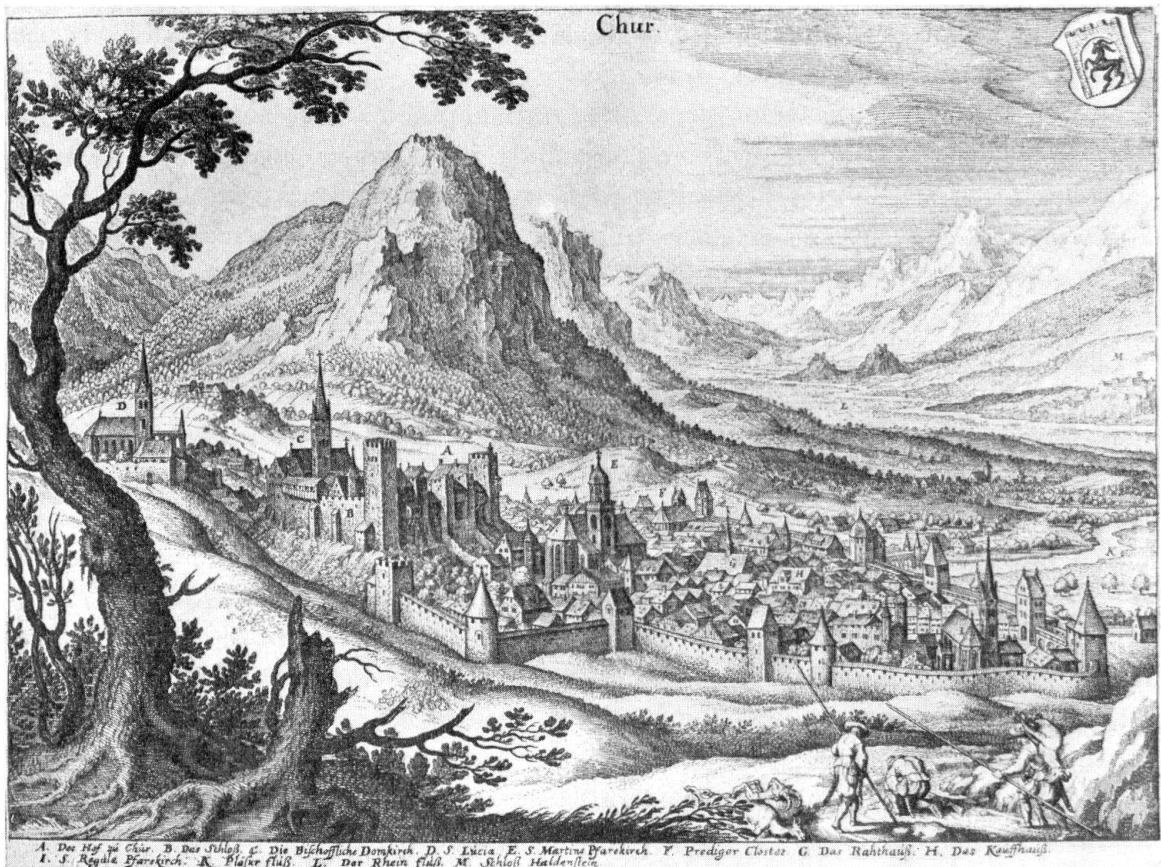
Chur aus der «Topographia Helvetiae» von Matthäus Merian, 1642