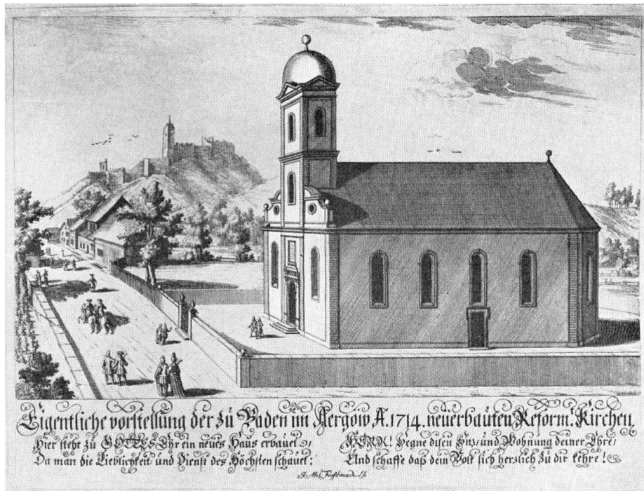
Baden. Reformierte Kirche. Stich von Johann Melchior Füßli (1677–1736)

Mahler» 10 ). Der Stuck und die drei Glocken, gegossen von Johannes Füßli, tragen die Jahrzahl 1717 11 ).