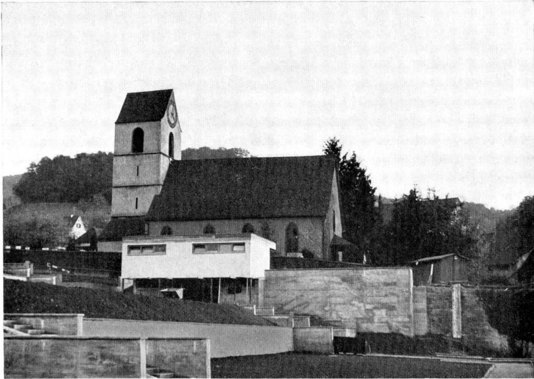
Münchenstein. Kirche von Norden gesehen, mit neuem Gerätebau

nahmen des Geometers O. Fr. Meyer von 1678, wo Münchenstein in der Aufsicht erscheint, erfahren wir, daß eine bescheidene Kirchhofmauer die Kirche umgab. Was uns die Zeichnungen von Emanuel Büchel um 1740 bestätigen, ist das kurze Langhaus mit den beiden gotischen Maßwerkfenstern. Die skizzierten Rhomben auf dem Dach des Schiffes und des Turmes lassen vermuten, daß die Ziegel einst farbig glasiert waren. Von dem damals noch intakten ummauerten Dorf, das während der französischen Revolution dann 1789 zerstört worden ist, nehmen wir beiläufig Notiz. In der Zeit der romantischen Aquarell- und Zeichenkunst häufen sich geradezu die Ansichten von Münchenstein, wobei die naturgetreue Wiedergabe der Architektur mit denjenigen der früheren Epochen übereinstimmt. Blätter von A. Winterlin (1805–1894) oder J. H. Luttringhausen (1783–1857) dürften vor der einschneidenden Erweiterung des Langhauses im Jahre 1857 entstanden sein, da sie stets noch die beiden Fensterachsen aufweisen.