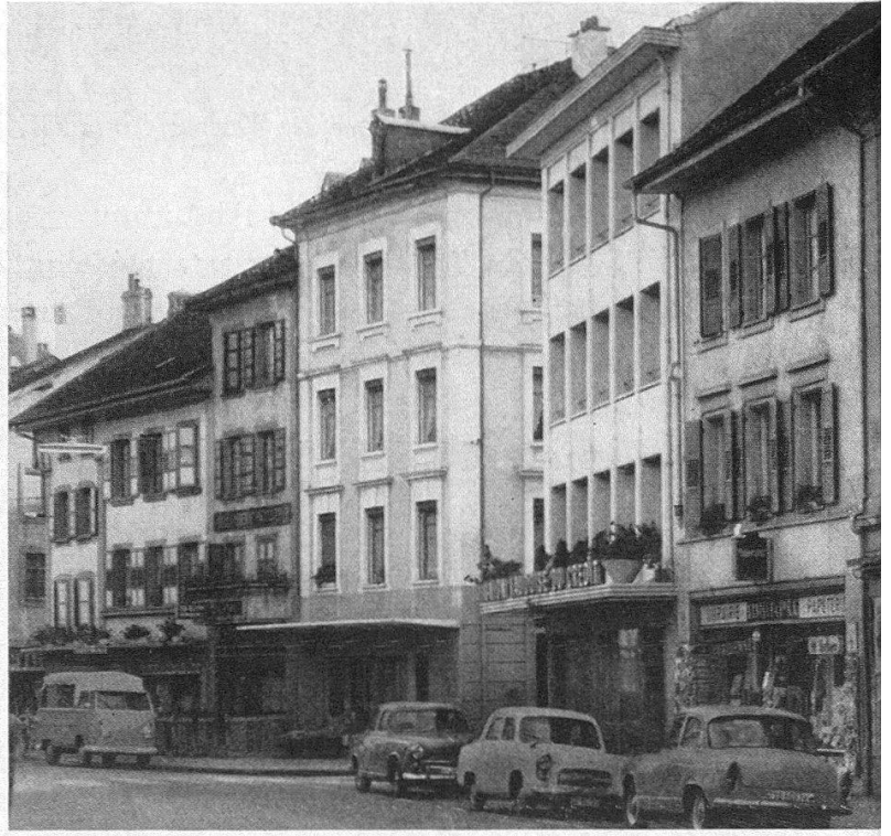
Payerne, Rue de Lausanne, Blick gegen Süden. Links: alter Zustand. Rechts: Neubau Union Vaudoise du Crédit, Einmündung Ruelle des deux-tours.

traditionellen lebensspendenden Kraft erhalten möchte. Sie bringt zudem notwendigerweise eine Dezentralisation mit sich, die eine Zerstörung der eigentlichen Urbanität zur Folge hat. Daneben besteht die Möglichkeit einer «unehrlichen Defensive», nämlich die der «Tapetenstadt», bei der zwar auf den ersten Blick der alte Bestand konserviert wurde, aber auch das traditionelle Leben zu einem scheinbaren absinkt. Hofer betonte, daß er eine «konforme Entwicklung» für die richtige halte. Diese Möglichkeit der Tradition als zeitgemäßes Weitergehen könne er zwar nicht an ausgeführten Beispielen demonstrieren, da einleuchtende Projekte in der Regel auf dem Papier geblieben seien. Auch könne man keinesfalls durch grundsätzliche Direktiven dem Problem gerecht werden.