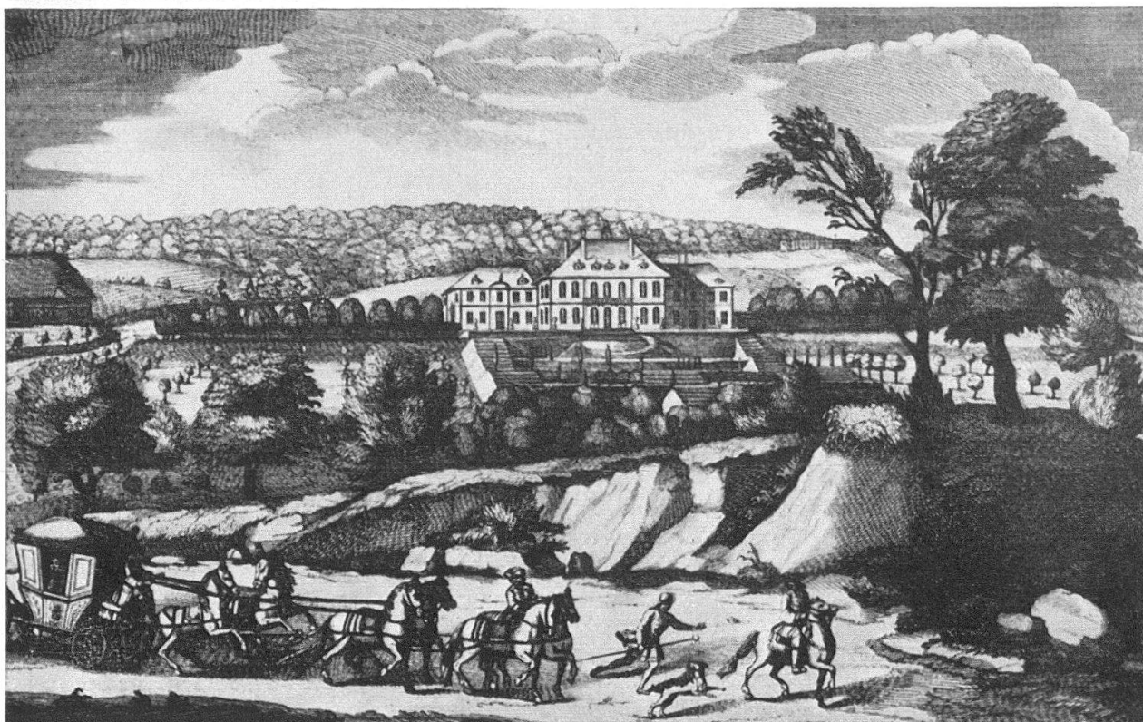
Joh. Grimm/Rud. Nöthiger 1740: Schloß Hindelbank