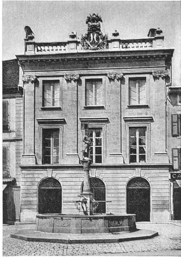
Orbe, hôtel de Ville, façade