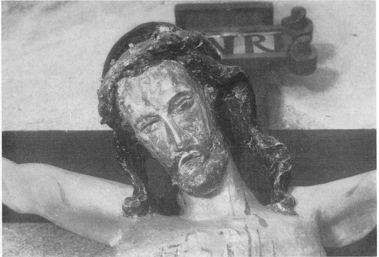
Kopf des Kruzifixus aus Vals. Vgl. Abb. S. 183

Escholzmatt (Futterer, Abb. 63, um 1350) wegen der gestreckten Haltung und der Tendenz zur Symmetrie beizuziehen; in der formalen Konfrontation versagt aber dieser Vergleich. Auffallend wird dabei die Ausbildung der Brustpartie am Valser Korpus, die gegenüber den genannten Beispielen in geradezu naturalistischer Weise durchgebildet und ertastet erscheint. Vergleicht man noch den Kruzifixus des Liebenfelser Meisters aus St. Katharinenthal von ca. 1330 (Futterer, Abb. 63 und 269), so mag sich daraus wiederum die Spätdatierung erhärten und sich der Abstand von der volleren schwäbischen Gestaltungsart erweisen – sehr schön ersichtlich im Gesichtstypus. Aus der Lage Graubündens heraus müssen vor allem auch die Werke der Nachbarländer Vorarlberg und Tirol beigezogen werden. Aus dem mir zugänglichen Material hat sich nichts Verwandtes ergeben. So bleibt denn vorläufig nur die Möglichkeit, einen allgemeinen Eindruck festzuhalten. Und hier würde man gerne davon sprechen, daß irgendwie die Formenkraft der französischen Hochgotik mit ihrer internationalen Wirkung noch spürbar sei; allerdings ist die Körperlichkeit der nackten Teile damit in starkem Widerspruch.