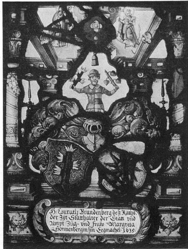
Allianzwappenscheibe Brandenburg-Sonnenberg, Zug, 1635, von Michael II Müller, Zug

Dutzend gezählt werden –, die man ihm offenbar nicht gezeigt hatte. Der Gesamtbestand der Glasgemälde aus Nostell Priory dürfte deshalb etwas über 300 Stück betragen. Zusammengerechnet mit den gegen 500 Stück in der Kirche von Nostell zurückgebliebenen Scheiben kommen wir auf einen Totalbestand von gegen 800 schweiz. Glasgemälden!