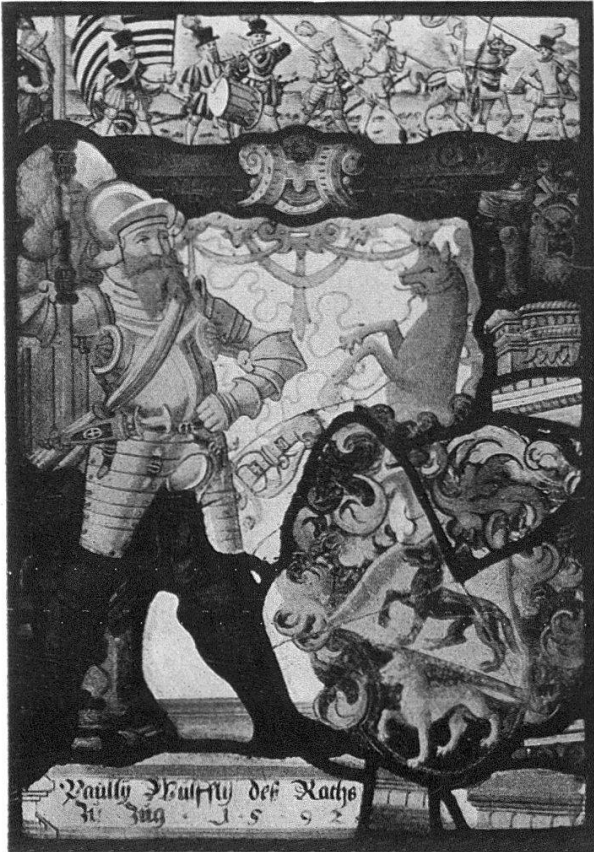
Wappenscheibe des Paul Wulflin, Zug, 1592, von Bartli Müller, Zug