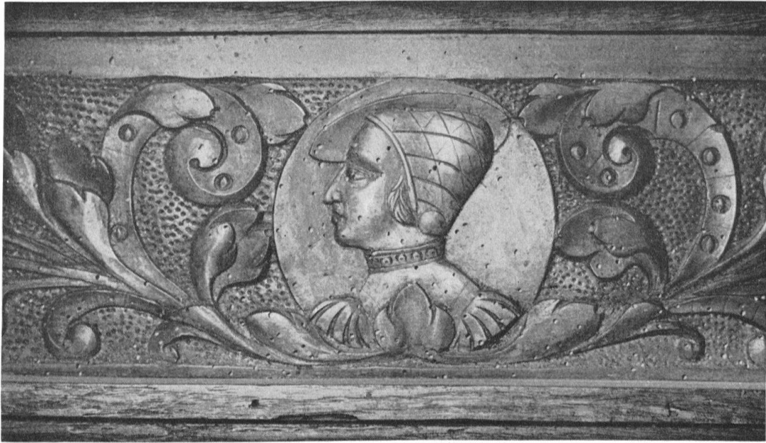
Syrgenstein, Bibliothek. Teil des Gesimses an der Ostwand

flache Pilaster mit korinthisierenden Kapitellen in hochrechteckige Wandflächen gliedert, die nach oben von einem geschnitzten Gesims in Höhe der gleichartig gestalteten Türstürze abgeschlossen sind. Zahnschnittleisten und Klötzchenfriese begrenzen die Gesimse unten und oben. Die Rankenschnitzereien in den Gesimsfeldern zeichnen sich durch ständigen Wechsel der Figuration aus: Langgestreckte Ranken enden entweder in Blatt- oder Kerbbandrollen; die Ranke rechts der Nordtür in der Ofenecke wird statt durch Blätter durch heraldisch geordnete, in Kerbbandrollen endende Delphine gebildet, ein in jener Zeit beliebtes Symbol des Glücks. Sonst sitzen in der Mitte entweder Rosetten oder Porträtmedaillons und je einmal ein Kelch und ein Ziborium. In fast allen Verkröpfungen über den die Wandstücke begrenzenden Pilastern finden sich weitere Tondi mit männlichen und weiblichen Köpfen; hier ist in der Ofenecke der östlichen Täferung auch das oben genannte Tondo mit Totenkopf, Stundenglas und Jahreszahl «1539».