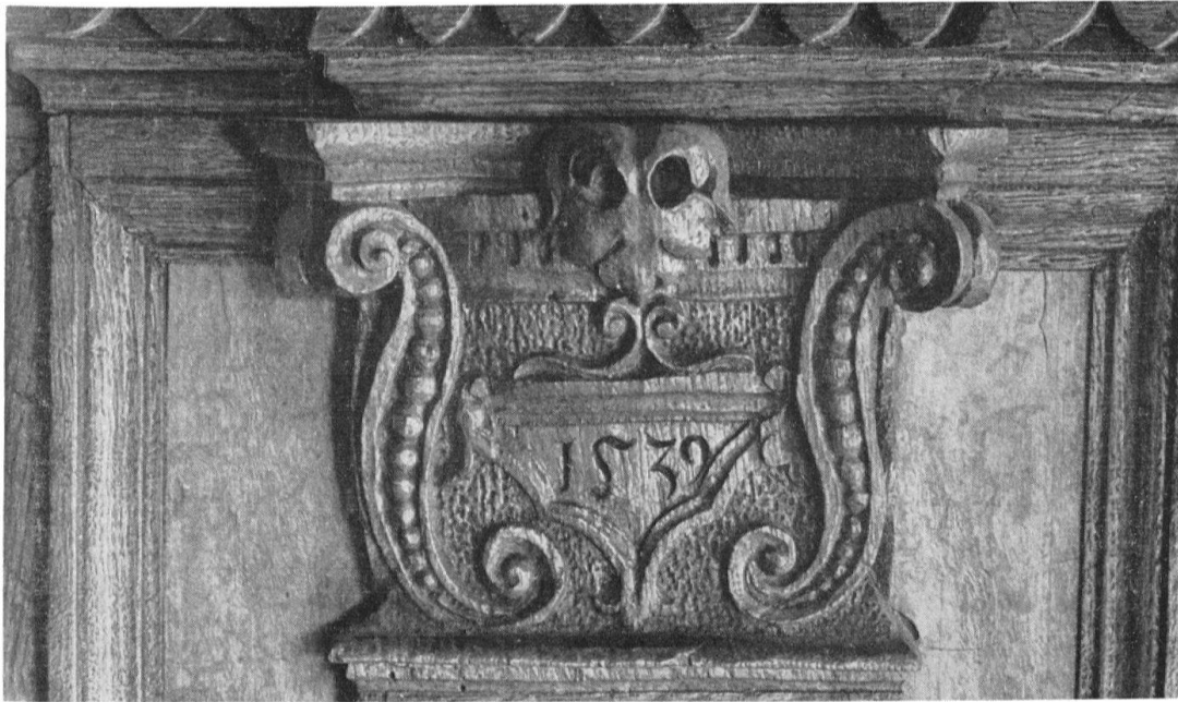
Syrgenstein, Bibliothek. Rechter Pilaster (Teil) der Osttür