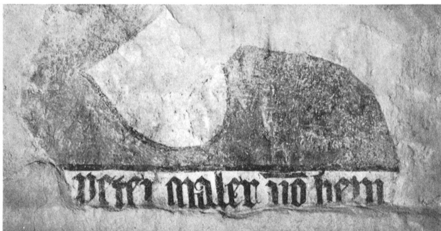
Scherzligen, Kirchenschiff, Nordwand: Inschrift «peter maler vo bern» mit Stifterwappen (?) unterhalb des Stadtbildes