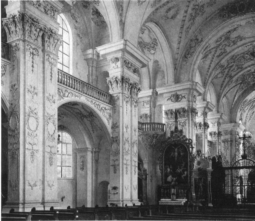
St. Urban. Klosterkirche (1511–1515). Inneres gegen Norden und Chor

für Plätze, ein italianisierendes Element, die Erinnerung an die straff geschlossenen, hochragenden Palazzi der Renaissance.