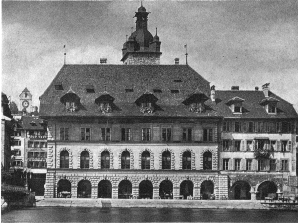
Luzern, Rathaus. Ansicht der Südfassade 1602–1604

«Renaissance» empfundene – Bauart keineswegs ablehnte, sondern sich zu eigen machte. Gradmesser hierfür ist das Luzerner Rathaus. Es war 1600 offenbar für die Luzerner selbstverständlich, Macht und Würde ihres Staatswesens in einem italienischen Renaissancebau darzustellen und hiezu einen Oberitaliener, ANTON ISENMANN aus dem Primmell, und mailändische Werkleute zu berufen. Kein treffenderes Symbol für die innerschweizerische selbstverständliche Verknüpfung von Fremdem und Einheimischem gibt es als das Luzerner Rathaus: von den Arkaden bis zum Kranzgesims stolze italienische Renaissance, aber unter einem hohen Luzerner Bauernhausdach. Zur gleichen Zeit eiferte man aber auch im aristokratischen Wohnbau dem Ritterschen Palast nach, trotzdem dieser nach dem plötzlichen Tod des Bauherrn schließlich Jesuitenkolleg geworden und damit der privaten Sphäre entzogen war. Um 1600 erhielt das gotische Fleckensteinhaus (heute Göldlinhaus) in Luzern einen wenigstens dreiseitigen toskanischen Säulenhof, desgleichen – heute völlig verbaut – das Pfyfferhaus am Mühlenplatz. Das Am Rhynhaus neben dem Rathaus bekam eine italienische Fassade und im Hof als Verbindung von Vorder- und Hinterhaus eine dreigeschossige toskanische Arkadenbrücke.