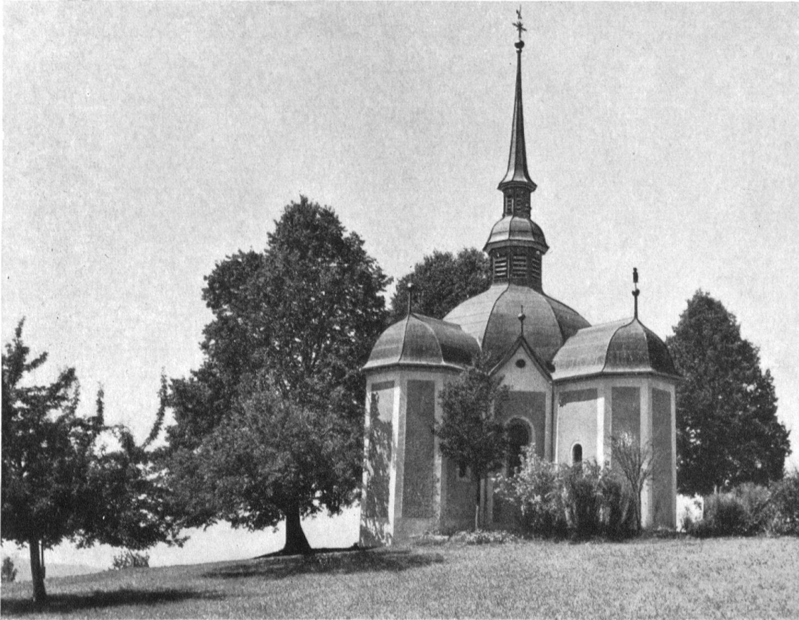
Buttisholz. Wallfahrtskirche St. Ottilien, 1669. Ansicht von Südosten