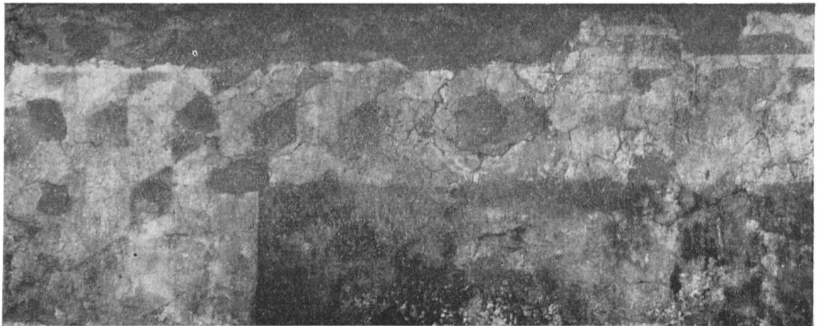
Wandgemälde-Fragment aus der Kirche von Bassersdorf. Südwand. 3. Viertel 15. Jh.

flächen lassen sich noch erkennen: an der Südwand östlich der Turmtüröffnung Striche wie von Pelzzotteln (?) und westlich der Turmtüröffnung links die Saumpartie eines gelben, weit ausladenden Gewandes einer weiblichen, sowie rechts davon die Füße einer männlichen Figur, die nach links schreitet. An der Ostwand des Kapellenschiffes endlich sind das Segment eines braunroten, mit schwarzen Linien gefaßten Kreises und rechts darunter zwei rote Sterne zu erkennen. Es scheint, daß es sich hier um den allerletzten Rest eines um den Chorbogen gelegten Medaillon-Kranzes mit der Darstellung der Rosenkranzgeheimnisse handelt. An der schrägen Chorbogenleibung erkennt man den braunroten Saum einer wohl weiblichen Figur, deren Gewand die Füße völlig verdeckt und links und rechts weit ausläßt.