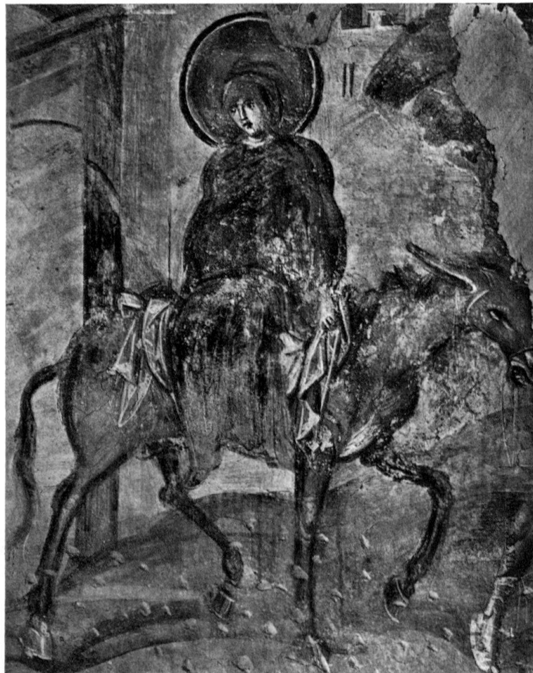
Castelseprio (Italien): Wandgemälde in der Kirche S. Maria Foris Portas

RIVA SAN VITALE: Kirche S. Vitale, Kirche Santa Croce, siehe Seite 11.