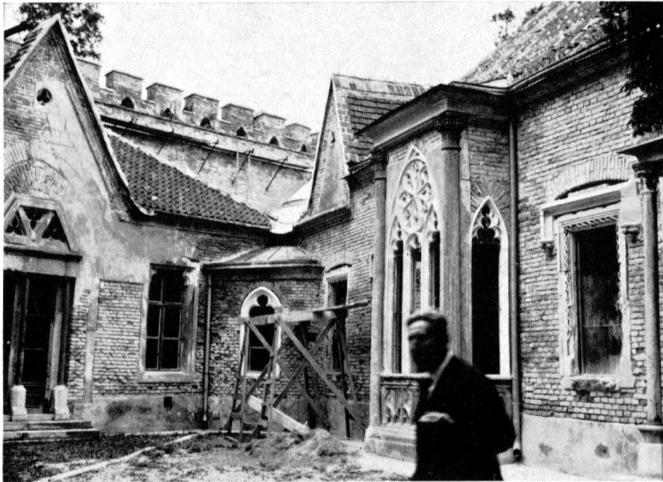
Laxenburg bei Wien. Franzensburg: innerer Hof während der Restaurierung; Architektur von 1798–1801

gehen, wenn nicht besondere gesetzliche Schutzmaßnahmen ergriffen würden. Voraussetzung dazu sei aber, daß die Öffentlichkeit vermehrt mit den Pflichten der Denkmalpflege bekannt und vertraut gemacht werde.