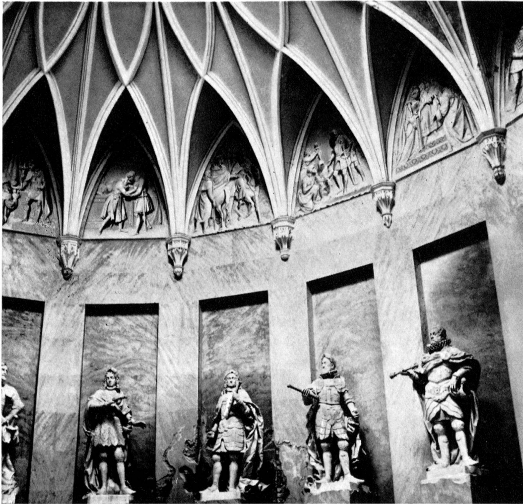
Laxenburg bei Wien. Franzensburg: Habsburgersaal mit den Statuen der 17 regierenden Mitglieder des Hauses, von Rudolf I. bis Maria Theresia. In den Zwickeln charakteristische Szenen aus dem Leben der betreffenden Herrscher, 1822–1836