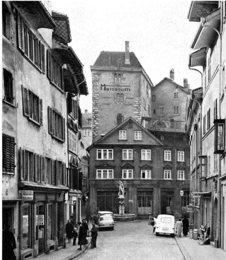
Grimmenturm, Ostseite, nach den Umbauten von 1873 und der Reduzierung des Daches auf «das übliche Maß». Zustand Februar 1964

Beim Abbruch des Zinnendaches von 1873 zeigte es sich, daß das steinerne Hauptgesims, bestehend aus einer Hohlkehle und einer breiten Stirnplatte mit kleiner Fasse, nur noch in den unteren Partien die originale Substanz aufwies. Die fehlenden Teile wurden 1873 mit Backsteinen aufgemauert und verputzt. Die alten Gesimsteile zeigten Reste einer roten, grauen und schwarzen Polychromierung. Dieselben Farbspuren konnten auch auf den Gewänden der gekuppelten gotischen Fenster an der Ostseite nachgewiesen werden.