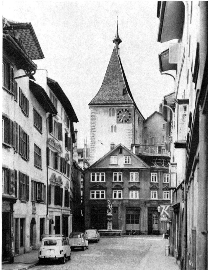
Grimmenturm, Ostseite, nach der Wiederherstellung. Zustand April 1966

nung möglichst anzupassen, wurde ein Arbeitsmodell erstellt, das mit dem vorhandenen Dokumentationsmaterial genauestens verglichen wurde.