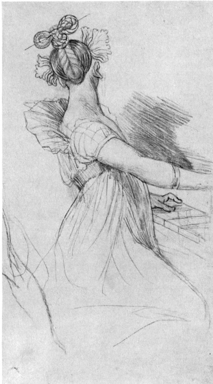
Johann Heinrich Füssli, Junge Frau am Spinett, Bleistift. Kunsthau Zürich. Depositum der Gottfried Keller-Stiftung

Einige statistische Angaben mögen den Überblick vervollständigen: