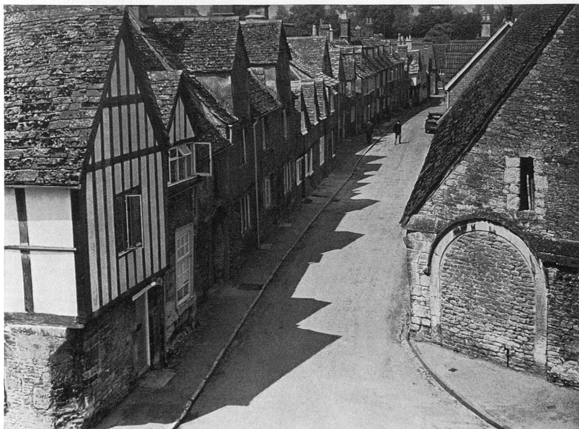
Lacok (Somerset). Une rue du village, propriété du National Trust