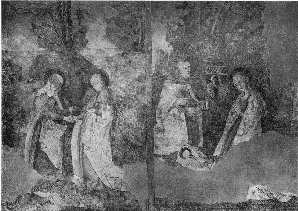
Muttenz, Pfarrkirche. Zwei erhaltene Wandgemälde an der Südwand des Schiffes (7 und 8). Heimsuchung und Geburt Christi. Nach 1507

mas und Bartholomäus) haben nördlich des Eingangs an der Westwand ihren Platz (32 bis 43). Zwischen dem letzten Apostel, Petrus (43), und dem kleinteiligen Zehnergemälde (44) ist eine weitere Gestalt einzufügen, Christus als Herr und Meister. In Oltingen schließt die Reihe der Apostel mit dem Schmerzensmann, während wir hier den bekleideten Christus annehmen dürfen.