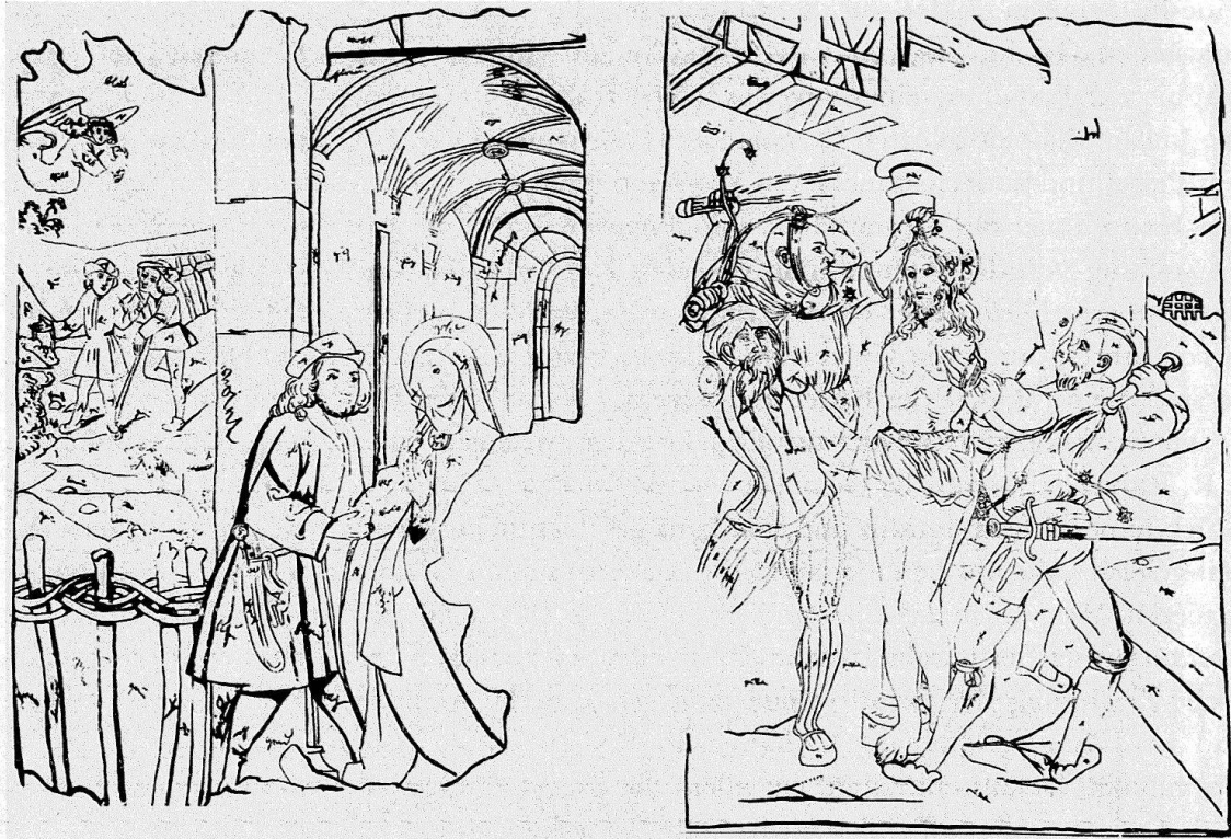
Muttenz, Pfarrkirche. Joachim und Anna an der goldenen Pforte (Südwand 2) und Geißelung (Nordwand 21). Nach 1507. Pausen von Karl Jauslin

Das Bildprogramm beginnt an der Südwand unmittelbar am Chorbogen und setzt sich in einer zweiten Reihe gegen Westen fort. Jedes Gemälde ist etwa 2 m hoch und etwa 1,50 m breit und durch gemalte schmale Bänder getrennt. Die Marienlegende und die Jugend Christi beginnen mit dem Opfer Joachims (1). Obwohl 3 und 6 durch die vergrößerten Fenster von 1630 zerstört sind, kann kein Zweifel über die fehlenden Bilder bestehen: Mariä Geburt und Verkündigung gehören in diesen nahtlosen Zyklus. Die Visitatio und die Geburt Christi (7 und 8) sind die einzigen erhaltengebliebenen Gemälde, die uns einen Begriff von der ursprünglichen Bildauffassung, der Farbgebung und der figürlichen Gestaltung vermitteln. Während oben acht Bildfelder angenommen werden dürfen, sind es unten nur deren sechs, da dort die alten Fenster eingesetzt waren.