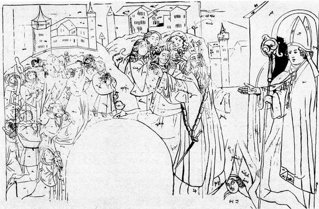
Muttenz, Pfarrkirche. Wandbild im Vorchor. Szene aus der Arbogastlegende (29). Um 1450? Pause von Karl Jauslin

Gegenüber auf der Evangelienseite (Nordwand) beginnt im Westen die Passion wie üblich mit dem guterhaltenen Einzug in Jerusalem (15), ein Bild, das uns von Schongauer bis Dürer vertraut ist, wobei auch hier der Einbezug des Landschaftlichen auffällt. Nach dem Abendmahl (16) fallen gleich zwei Szenen aus, von denen nur eine gesichert ist, nämlich Christus im Garten von Gethsemane. Ob alles bis vor der feststehenden Geißelung und Dornenkrönung (21 und 22) durch Einfügung der Verspottung sich verschiebt, ist leider nicht ausfindig zu machen. In der untern Reihe kann Christus am Kreuz nicht ausgelassen worden sein: dieses zentrale Bild folgt auf die Kreuzannagelung (25), die durch die Pause belegt ist. Unter Verzicht auf Auferstehung und Himmelfahrt, deren transzendente Aussage dem naturhaften Maler wenig lag, schließt dieser Passionszyklus mit der Beweinung (im Hintergrund Grablegung) und Christus in der Vorhölle (27 und 28). Auch hier wieder, in den beiden erhaltenen Wandgemälden unmittelbar an der Westwand, die Kontrapunktik des Meisters: unterhalb des Triumphzuges durch Jerusalem steht die Erniedrigung in der Schaustellung vor den Juden (15 und 23).