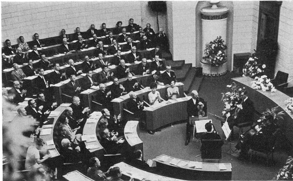
Die Festversammlung im Großratssaal in Luzern; sie hörte die Ansprachen von Prof. Dr. A. A. Schmid und Bundesrat H. P. Tschudi

Zeit sein Maximum. Dabei ist zu bedenken, daß die Bundesbeiträge in den ersten Jahrzehnten in der Regel 50% der subventionierbaren Kosten betrug. Erst im Reglement von 1914 wurden sie, je nach der Bedeutung des zu restaurierenden Bauwerks, auf maximal 30, 40 und 50% begrenzt. 1912 beschloß der Bundesrat angesichts der zunehmenden Verschuldung der Gesellschaft durch feste Subventionszusicherungen, die indirekt auch den Bund engagierten, bis auf weiteres alle neuen Gesuche zurückzustellen. Seit 1914 wurden aus dem gleichen Grunde bei Kostenüberschreitungen einstweilen auch keine Nachsubventionen mehr bewilligt.