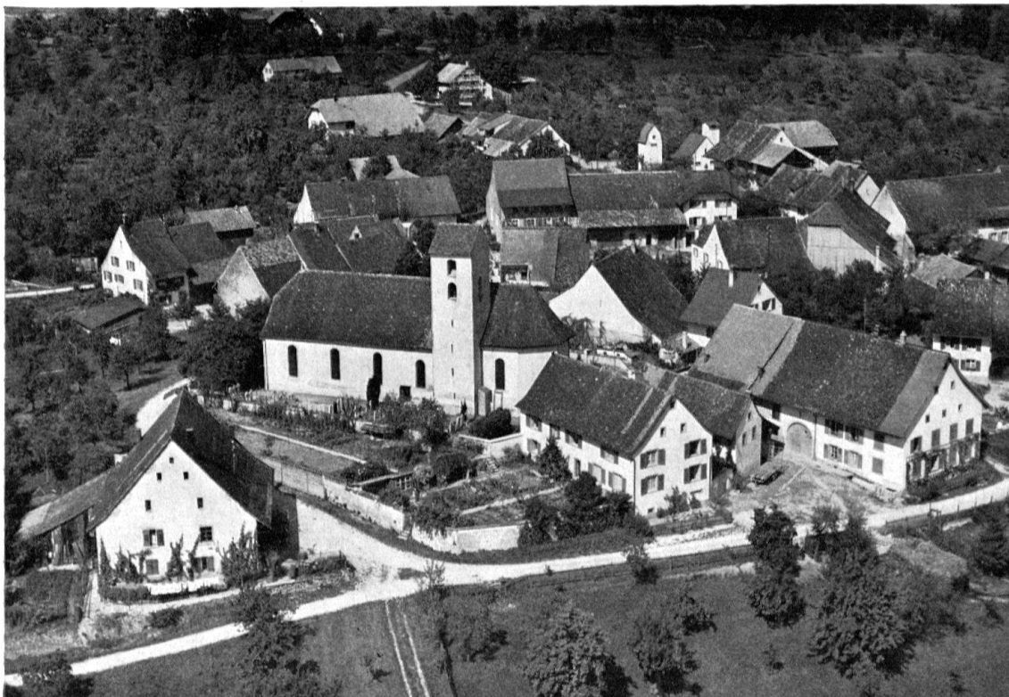
St. Pantaleon, SO. Ein geschlossenes und fast unverfälschtes Dorfbild im Jura. Bei der Kirchenrestaurierung wurde ein Bundesbeitrag gewährt mit der Bedingung der Sorgfaltspflicht für den ganzen Kirchenbezirk