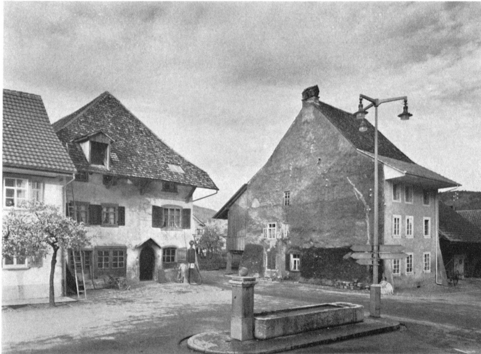
Niedererlinsbach, SO. Altes Dorfzentrum mit charakteristischen spätgotischen Bauten

len. Dem Verkehr fallen durch reihenweise Abbrüche ganze Straßenbilder und Dorfzentren zum Opfer – meist vergeblich, denn die Ortschaften müssen nach einigen Jahren doch umfahren werden (Augst, Trimbach, Glis usw.).