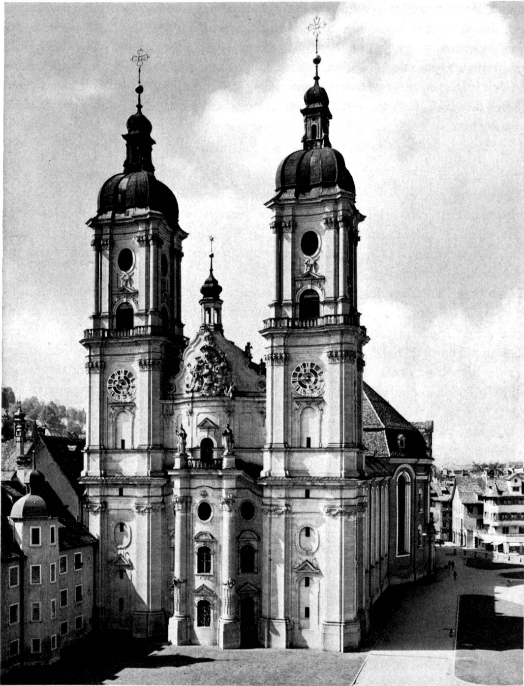
Kathedrale St. Gallen