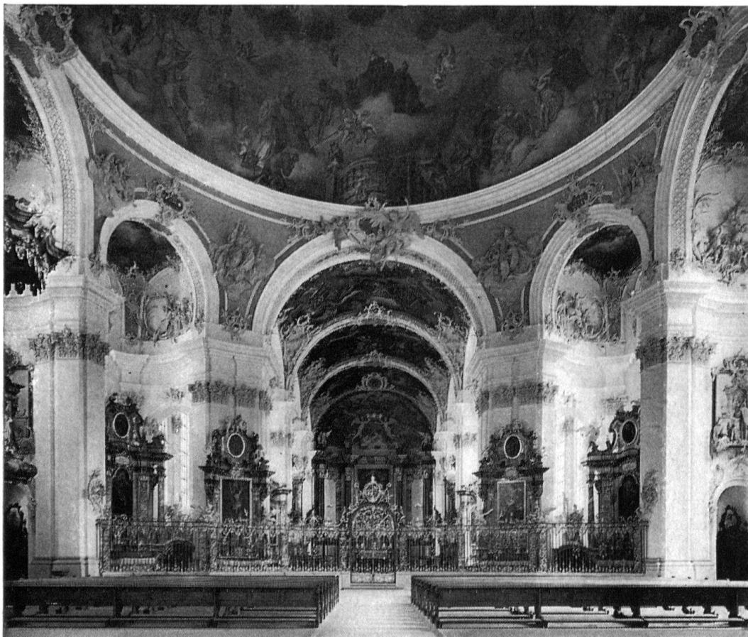
Blick von Westen in Rotunde und Chor