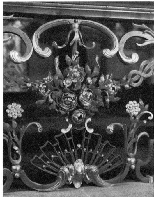
Links: Ausschnitt aus dem Chorgestühl. J. A. Feuchtmayer. Rechts: Ausschnitt aus dem Chorgitter. Joseph Mayer, 1769–1771