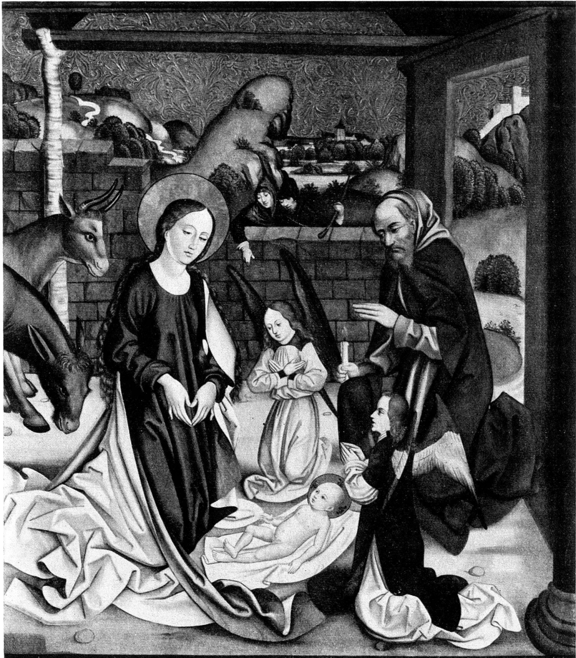
Abb. 3. Geburt Christi, Rückseite von Abb. 2

der Sammlung Forrer einem Luzerner Meister zusprach 5 . Die Beschneidung bestätigt nun unsere früheren Überlegungen, indem sie in Stil und Technik auch mit den Flügelbildern des Konstanzer Meisters in bischöflichen Besitz St. Gallen übereingehen 6 . Wieder treffen wir die gemessenen, behutsamen Bewegungen der Figuren und den Willen zu einer sorgfältig ausgewogenen Komposition mit rahmenden Elementen. Die bunte Koloristik der St.-Galler Flügelbilder kehrt in den lauten Lokalfarben der Beschneidung wieder, wo das leuchtende Rot der Gewänder der Dienerin und des Hohepriesters mit dem Azuritblau