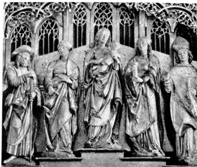
Schreinaltar aus der Kirche San Gaudenzio in Baceno. Um 1526

Eschental ob seiner kriegerischen Vergangenheit und ob seiner noch in die Gegenwart nachwirkenden Walserkolonien das Interesse von Schweizer Historikern, Sprachforschern und Volkskundlern geweckt. Nach kunstgeschichtlichen Zusammenhängen ist unseres Wissens noch kaum gefragt worden. Während Walter Ruppen vor allem der barocken Kunst nachging, suchten wir andern auch die verborgenen Winkel nach allem Entdeckungswürdigen ab. Die notwendigerweise knappen Notizen wurden ergänzt durch die dürftigen Angaben der beiden italienischen Führer «Piemonte, Guida d'Italia del Touring Club Italiano, 1961» und «Giovanni De-Maurizi, L'Ossola e le sue valli, Domodossola 1954».