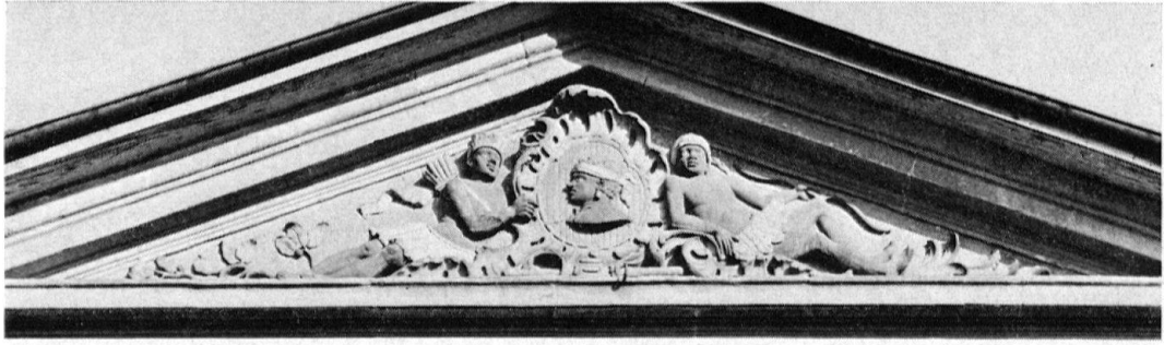
L'Hôtel de Ville d'Avenches. Le fronton sculpté par Johann-Friedrich Funk, 1754