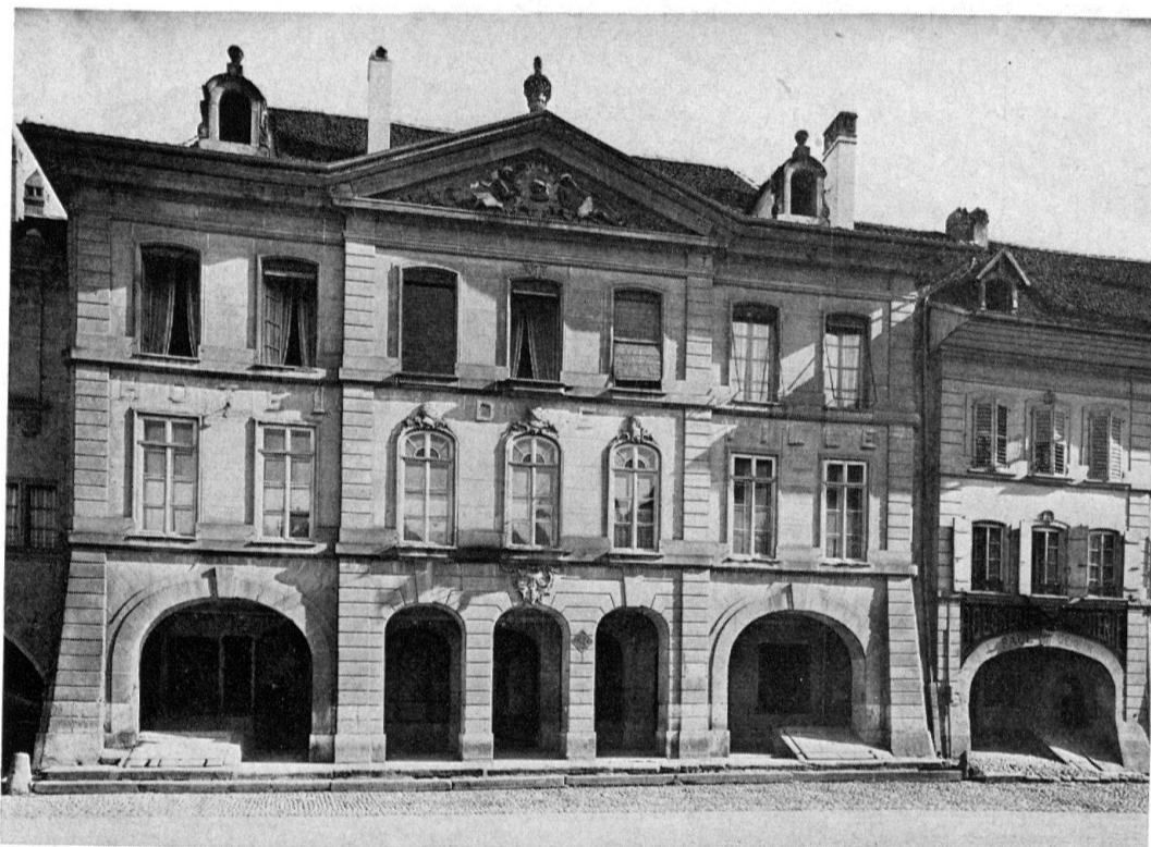
L'Hôtel de Ville d'Avenches. La façade, 1753/1754. Etat en 1968

achevé 1 . On voit donc par ces quelques notes que non seulement les plans de l'Hôtel de Ville d'Avenches sont bernois, mais aussi que toute l'exécution du travail de la pierre est l'œuvre d'ouvriers bernois: le cas semble assez rare dans le Pays de Vaud, au XVIII e siècle, pour être souligné ici.