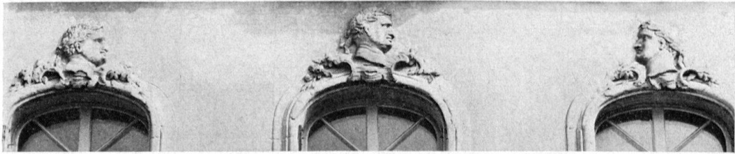
L'Hôtel de Ville d'Avenches. Têtes d'empereurs romains sculptées par J.-F. Funk, 1754

72, qui lui est aussi attribuée 3 . Les articulations horizontales-verticales de la façade sont ici comme là fortement mais sobrement soulignées par des refends étroits, pour ne pas dire mesquins, et des bandeaux; si ces bandeaux sont simplifiés chez Hebler, c'est-à-dire non doublés pour former comme une architrave, les corniches, elles, sont bien articulées en entablements schématisés dans lesquels se répercutent les verticales et l'on observe le même mélange, harmonieux, hiérarchique et habilement contrasté, de fenêtres à encadrement rectangulaire (étages inférieurs latéraux), à arc surbaissé (étages supérieurs) et en anse de panier (premier étage, au centre), qu'à la Gerechtigkeitsgasse 40 spécialement. Les tablettes des fenêtres se décrochent aussi sur les bandeaux continus et le même encadrement à moulure mince en baguette fortement saillante s'interrompt également sur l'assise inférieure en relief servant de base aux piédroits 4 .