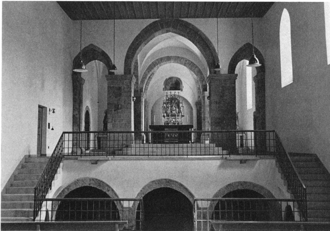
Chur, Kirche St. Luzius. Inneres der ehemaligen Prämonstratenser-Kirche nach der Restaurierung von 1951 durch Architekt Dr. W. Sulser