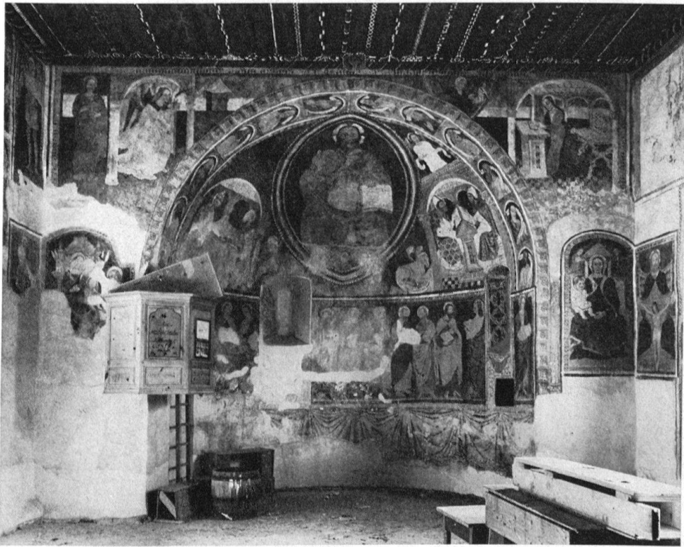
Pontresina, Kirche Sta. Maria. Apsis: die 12 Apostel, Christus in der Mandorla, umgeben von den 4 Evangelistensymbolen und flankiert von den 4 abendländischen Kirchenvätern; im Bogen die 12 Propheten; an der Ostwand des Schiffes Verkündigung (oben) und thronende Muttergottes (nördlich mit einer weiblichen Heiligen, südlich ohne Begleitung). Restaurierung im Gange

lichkeit – Linus Birchler . Doch bevor wir zur Denkmalpflege übergehen, werfen wir noch kurz einen Blick auf die Fortführung der Inventararbeit. In den 40er Jahren war es wiederum die Bündner Vereinigung für Heimatschutz, welche die Aufnahme der Bauernhäuser förderte. Dieses Material stand der Schweizerischen Gesellschaft für Volkskunde zur Verfügung, als sie 1945 an die Bestandesaufnahme im Kanton ging. 1965 und 1968 erschienen die beiden Bände des Bauernhauses von Christoph Simonett, welcher sich auf die technischen Aufnahmen von J. U. Könz in Guarda stützen konnte. Gegenwärtig sind zwei Inventare in Arbeit : die neue Burgenaufnahme durch Werner Meyer-Hofmann und die Inventarisierung der Orgeln durch Willi Lippuner 7 .