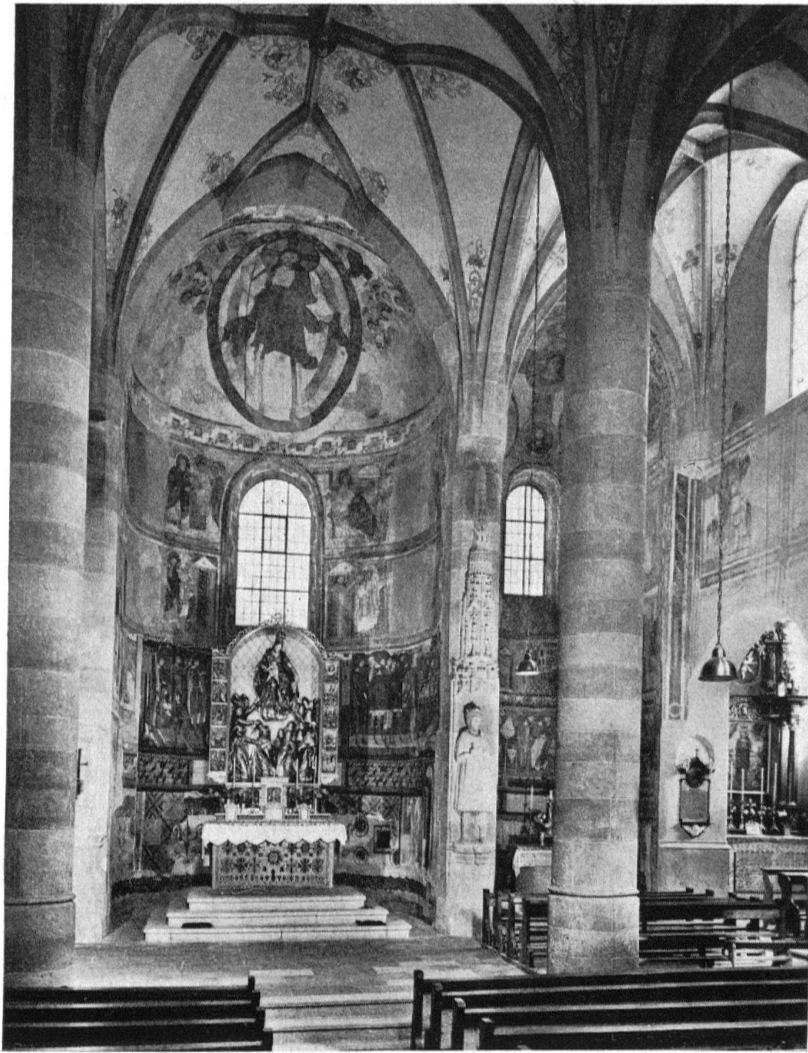
Müstair, Klosterkirche St. Johann. Mittel- und Südapsis mit ihrem karolingischen und romanischen Freskenschmuck. Dazwischen die lebensgroße Stuckstatue Karls des Großen unter spätgotischem Baldachin. Über dem Hochaltar ein moderner Schrein mit dem hervorragenden Schnitzwerk des längst verschwundenen frühbarocken Retabels. Restaurierung 1940–1951 von Dr. W. Sulser. Gesamt-erneuerung der Klosteranlage mit Hilfe des Talerwerkes des Heimatschutzes im Gange

Es dauerte aber bis 1944, bis im Einführungsgesetz zum ZGB ein entsprechender Artikel aufgenommen wurde. Daraufhin erließ der Große Rat am 27. November 1946 eine Verordnung. Sie regelt die Zweckbestimmung in Natur- und Heimatschutz, die Kompetenz des Großen und Kleinen Rates sowie der Gemeinden, postuliert die Unterhaltungspflicht an künstlerisch, historisch oder naturwissenschaftlich wertvollen Objekten, das öffentliche Erwerbsrecht, die Beschränkung des Grundeigentums, den Denkmalschutz, die Enteignung und die Aufsicht über die Ausgrabungen. Eine Kommission, welche seit 1947 besteht (zuerst unter dem Präsidium von Oberingenieur Hans Conrad), bearbeitete zunächst zusammen mit den Privaten und Körperschaften die Geschäfte aus dem ganzen Gebiet des Natur- und Heimatschutzes 15 .