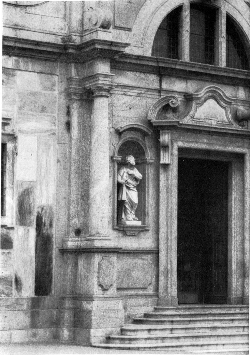
Mittelpartie der Fassade aus grobkörnigem Bergeller Granit. Gesimse und Schilder aus feinerkörnigem, dunklem Tonalit. Die Plastik besteht aus dem lichten Kalkstein von Saltrio (wie die Fassade von San Lorenzo in Lugano)

In der Barockzeit sind im Tessin unzählige Kirchen neu erbaut, oder, was die Fassaden speziell anbelangt, umgebaut worden. Obwohl fast alle großen Täler des Sopraceneri sehr reich an Gneisen von ausgezeichneter bautechnischer Qualität sind, begegnet man diesem allgemein als Granit bezeichneten Gestein wohl öfters an einzelnen Fassadenelementen (Portalen, Säulen von Vorzeichen usw.), jedoch kaum als Baustoff von ganzen, reicher gegliederten Fassaden.